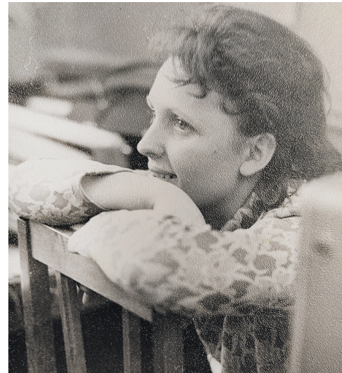
На заводе ЛЭМЗ. 1977 г.

сит: «Доченька, сиди здесь, никуда ни шагу. Жди меня. Я пойду получать паек». Через какое-то время она несет две круглые буханки хлеба. Я обомлела: «Мама, неужели это все нам?!». Мама улыбается: «Нам, доченька, нам! Ты только не ешь, я сама буду давать тебе понемногу. Если много съешь, умрешь». Спасибо ей за это грозное слово: она спасла меня, потому что в дороге, в поезде было все: и несварение, и заворот кишок, и выгруженные трупы. Моя мудрая мама сохранила мне жизнь и сама прожила до 80 лет.