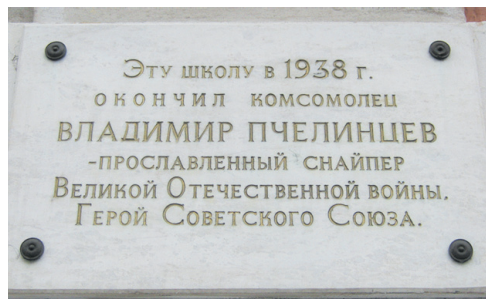
Мемориальная доска в Петрозаводске