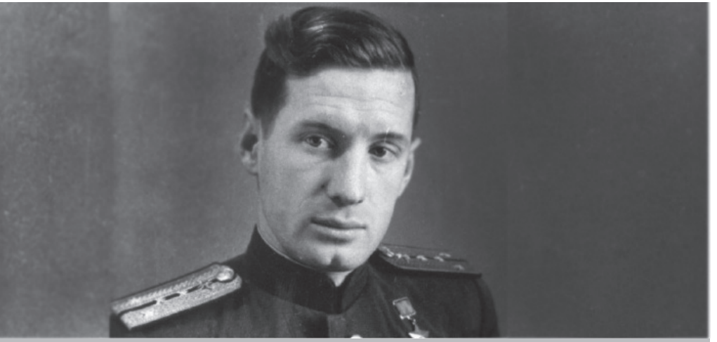
Их именами названы улицы округа