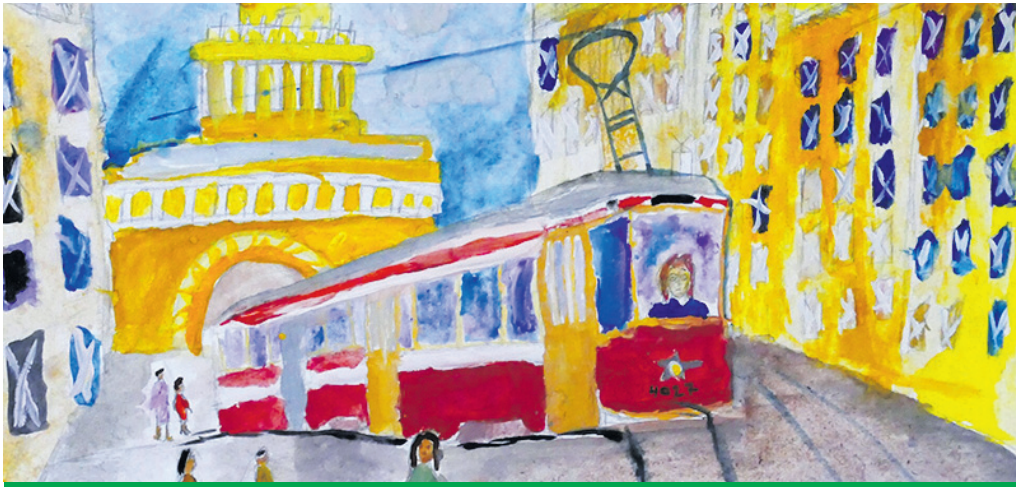
Первый блокадный трамвай 42-го года

ПЕЧАТНЫЙ ОРГАН МУНИЦИПАЛЬНОГО СОВЕТА МО СОСНОВАЯ ПОЛЯНА