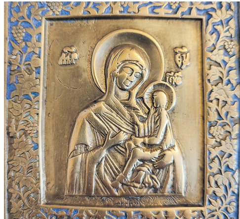
Икона Божией Матери, пережившая блокаду