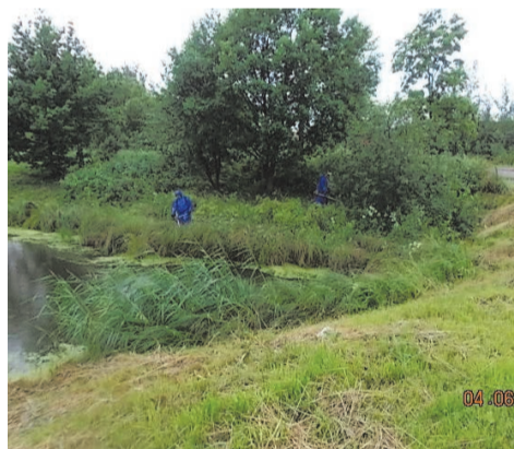
покос берега акватории Пионерстроя д.29

По многочисленным просьбам жителей, на детскую площадку расположенную по адресу: ул. Пионерстроя д.15 к.3 дополнительно установлено 5 (пять) скамеек и 5 (пять) урн.