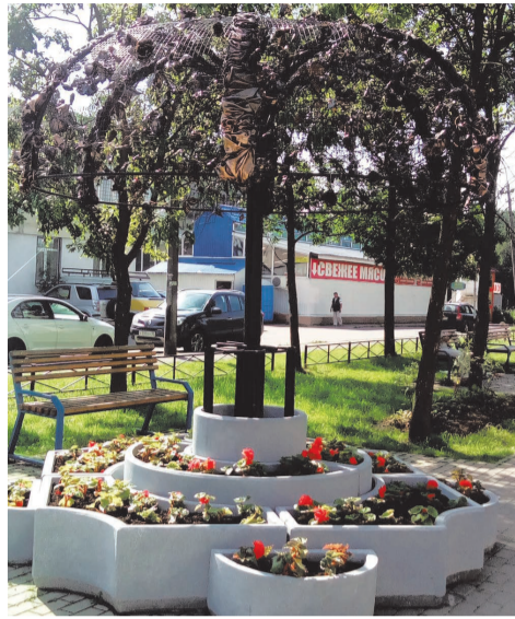
посадка цветов Ветеранов д.147-149

На пешеходной зоне расположенной по адресу: пр. Ветеранов д.147-д.149 установлен вазонный комплекс на сумму 91,5 т.руб.