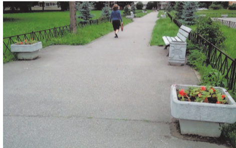
посадка цветов, ул.Пионерстроя д.15,корп.3

В последней декаде июня для придания красоты и ярких красок нашему округу мы выполнили работы по посадке цветочной рассады в вазоны на сумму 696,0 т.руб.