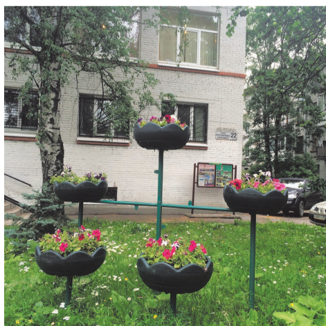
цветы Пограничника Гарькавого, д.22, корп.3

На пешеходной зоне расположенной по адресу: пр. Ветеранов д.147-д.149 установлен вазонный комплекс на сумму 91,5 т.руб.