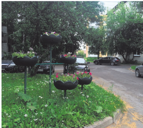
посадка цветов в вазоны