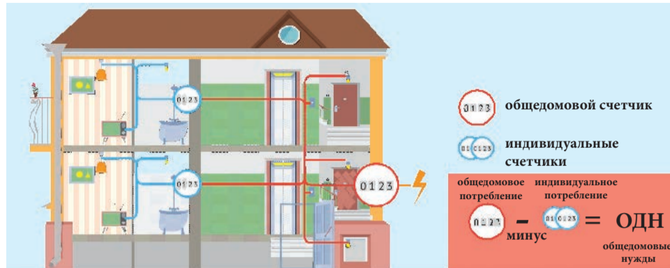
Схема «Общедомовое и индивидуальное потребление электричества»