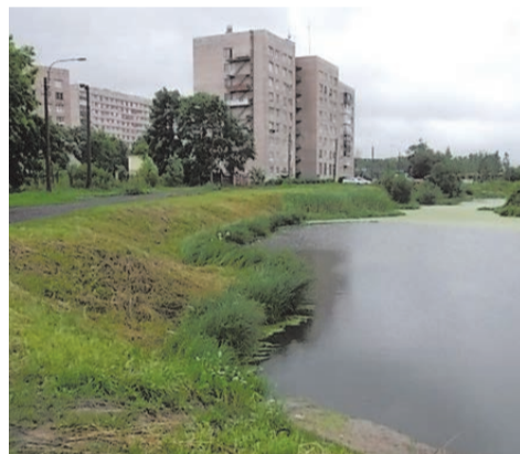
уборка и покос в акватории ул.Пионерстроя

В целях обеспечения санитарного благополучия населения в июне выполнены работы по уборке акватории и покосу береговой полосы следующих прудов: пруд б/н по адресу: д.29 ул. Пионерстроя и пруд б/н напротив д.72 Петергофское шоссе (стадион ЛЭМЗ) на сумму 54,0 т.руб.;