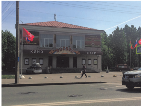
украшение ко Дню Победы

В мае к празднованию Дня Победы в Великой отечественной войне были произведены работы по размещению тематических баннеров, праздничных консолей и флагов.