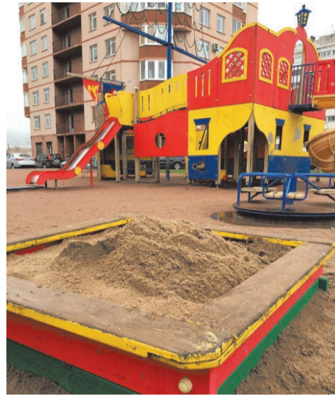
завоз песка Пионерстроя д.21, корп.1