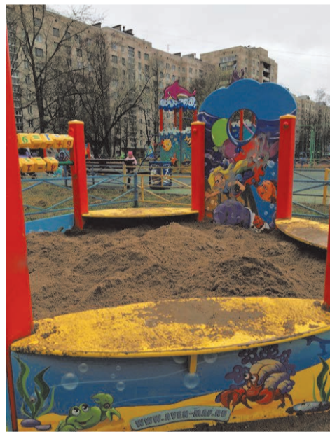
завоз песка Ветеранов д.149

По просьбе жителей будет произведена закупка и установка скамеек и урн.