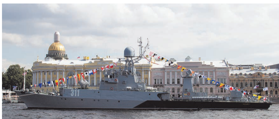
День ВМФ отметили на воде

ПЕЧАТНЫЙ ОРГАН МУНИЦИПАЛЬНОГО СОВЕТА МО СОСНОВАЯ ПОЛЯНА