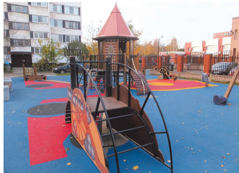
ул. Тамбасова д.6 к.1