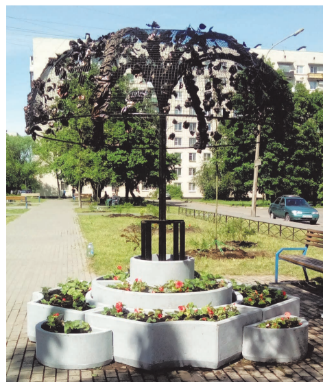
пр. Ветеранов д.149

Для придания опрятного и эстетичного вида нашим дворам мы выполнили работы по оборудованию контейнерных площадок на сумму 828,0 тыс.руб. по следующим адресам: