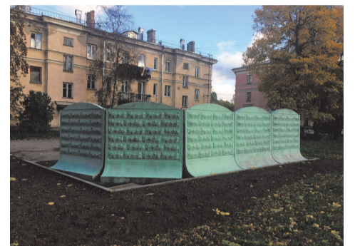
ул. 2 Комсомольская д.17

Как и в прошлые годы в целях обеспечения санитарного благополучия населения мы выполнили работы по ликвидации несанкционированных свалок по пяти адресам: