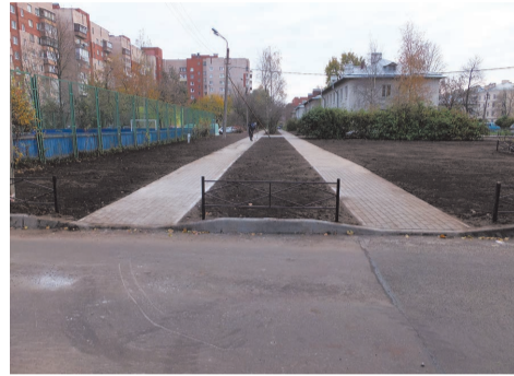
ул. Чекистов д.38

по адресу: ул. Пионерстроя, д.21 к.2 - д.23. Для комфорта наших жителей на данной территории выполнены устройство зоны отдыха с установкой уличных диванов, устройство пешеходной дорожки и цветника, восстановление газона.