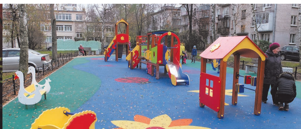
Благоустройство территории в 2016 году