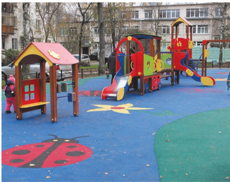
ул. П. Гарькавого д.26 к.1

По инициативе муниципального образования появилась яркая и нарядная детская площадка для малышей по адресу: ул. П. Гарькавого, д.26 к.1. На искусственном покрытии этой площадки изображены радующие глаз цветы и божьи коровки. Стоимость работ составила 2 760,0 тыс.руб.