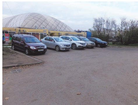
ул. Здоровцева д.10

Забывая об автомобилистах нашего округа, мы выполнили работы по устройству дополнительных парковочных мест по адресу: ул. Здоровцева, д.10. Стоимость работ составила 660,0 тыс.руб.