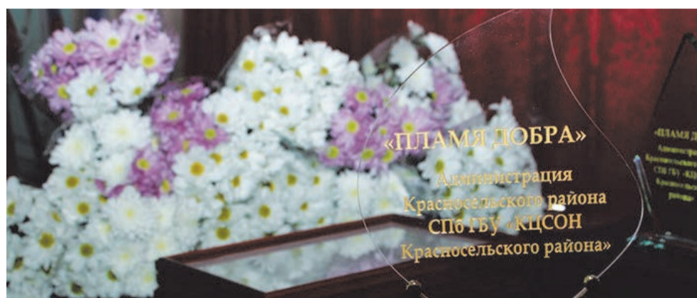
20 лет социальной сфере в Красносельском районе

ПЕЧАТНЫЙ ОРГАН МУНИЦИПАЛЬНОГО СОВЕТА МО СОСНОВАЯ ПОЛЯНА