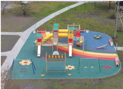
ул. Тамбасова д.2 к.1

В августе текущего года для создания более комфортных условий проживания и поднятия настроения детям младшего, дошкольного и школьного возрастов мы выполнили устройство тренажёрной и детских площадок с искусственным покрытием по адресу: ул. Тамбасова, д.2 к.1 - к.2. Основная цель выполнения работ по данному адресу - игры и занятия спортом на свежем воздухе.