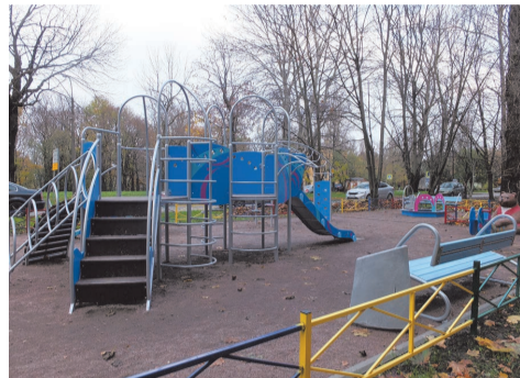
ул. Чекистов д.44

В III квартале выполнен большой объем работ по текущему (ямочному) ремонту асфальтобетонного покрытия на сумму 2 000,0 тыс.руб. Представляем вам некоторые адреса: