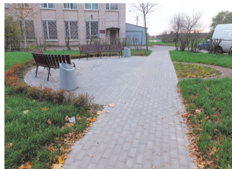
ул. Пионерстроя д.21 к.2-д.23

по адресу: ул. Пионерстроя, д.21 к.2 - д.23. Для комфорта наших жителей на данной территории выполнены устройство зоны отдыха с установкой уличных диванов, устройство пешеходной дорожки и цветника, восстановление газона.