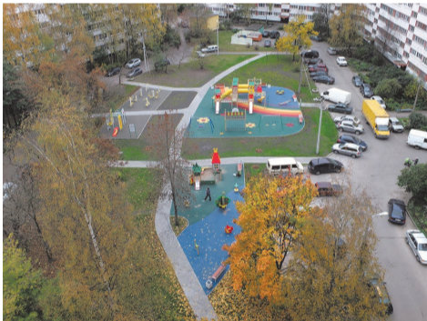
ул. Тамбасова д.2 к.1

На данном объекте также выполнены работы по устройству сети пешеходных дорожек в тротуарной плитке, устройству газона, посадка кустарника. Стоимость работ составила 8 100,0 тыс.руб.