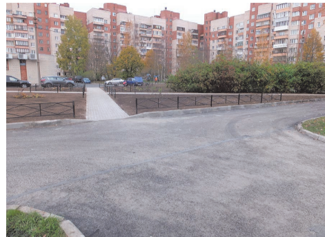
ул. Чекистов д.38

Летом была приведена в порядок территория внутриквартального озеленения