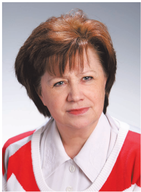
Дом нашего творчества

Творческие коллективы Дома детского творчества много лет носят звание образцовых, не раз становились победителями и лауреатами всевозможных конкурсов, фестивалей, смотров.