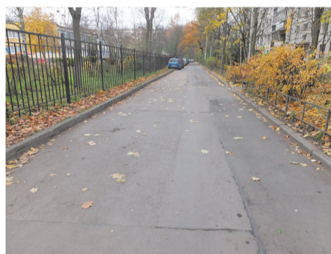
пр. Ветеранов д.151 к.2

Забывая об автомобилистах нашего округа, мы выполнили работы по устройству дополнительных парковочных мест по адресу: ул. Здоровцева, д.10. Стоимость работ составила 660,0 тыс.руб.