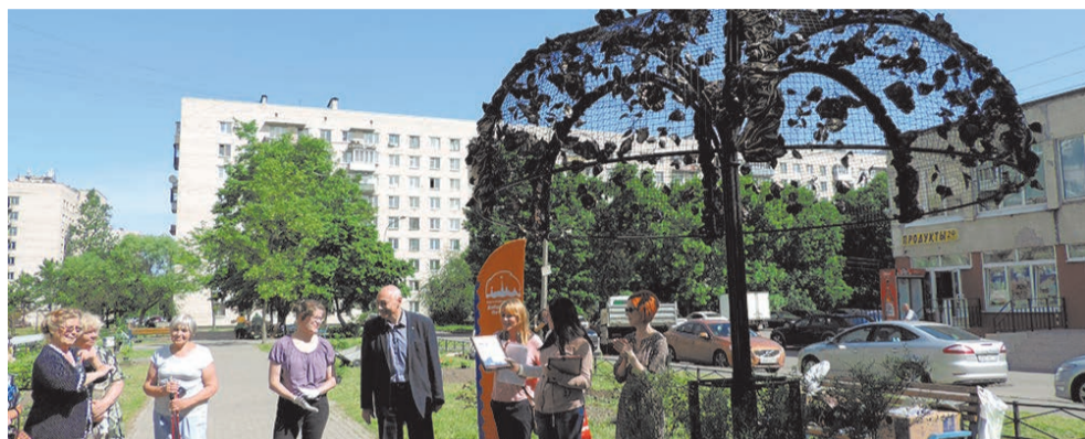
В Сосновой Поляне появился общественный сад

ПЕЧАТНЫЙ ОРГАН МУНИЦИПАЛЬНОГО СОВЕТА МО СОСНОВАЯ ПОЛЯНА