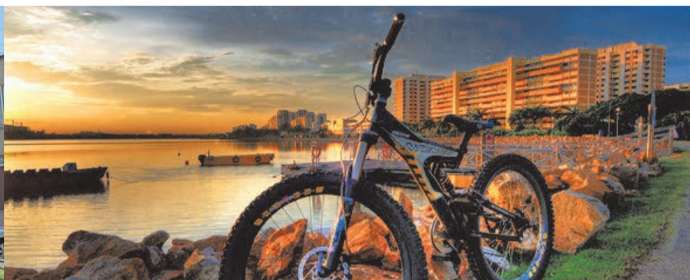
Велосипед - не игрушка, а транспортное средство