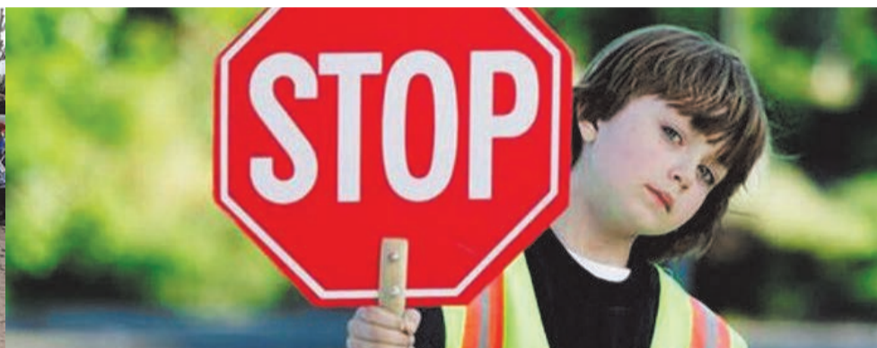
9 важных правил, которые помогут уберечь ребенка от ДТП