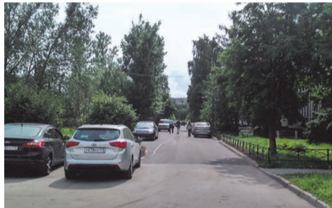
ул. Пионерстроя, д.10 кор.3

Завершены работы по текущему ремонту проездов, расположенных по адресам: ул. Пионерстроя, д.10 кор.3, ул. Пионерстроя, д.10-12.