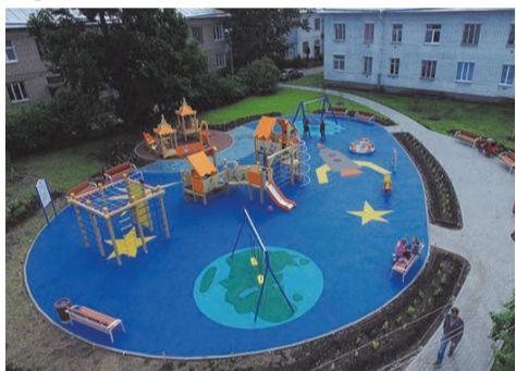
детская площадка ул. Пограничника Гарькавого, д.8 кор.1-2

В целях создания комфортных и благоприятных условий для детей младшего и школьного возраста завершены работы по устройству детской площадки по адресу: - ул. Пограничника Гарькавого, д.8 кор.1-2;