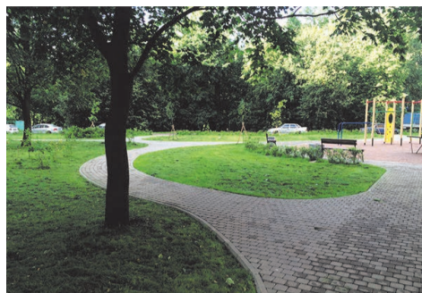
зона отдыха ул. Пионерстроя, д.7, кор.1-2

По пожеланиям наших уважаемых жителей произведена закупка и установка скамеек, урн и вазонов.