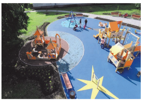
детская площадка ул. Пограничника Гарькавого, д.8 кор.1

На данной площадке установлено яркое детское тематическое оборудование «Незнайка на Луне», выполнены работы по устройству искусственного покрытия площадью 335,0 м 2 , пешеходных дорожек из тротуарной плитки 154,0 м 2 . Для придания площадке завершенного вида устроен пушистый газон 1 252,0 м 2 , посажены 283 декоративных кустарника и десять деревьев.