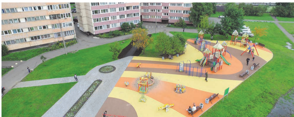
Осеннее благоустройство в 2017 году

ПЕЧАТНЫЙ ОРГАН МУНИЦИПАЛЬНОГО СОВЕТА МО СОСНОВАЯ ПОЛЯНА