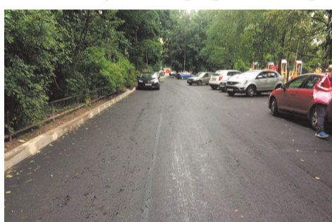
ул. Пионерстроя, д.10-12

По пожеланиям наших уважаемых жителей произведена закупка и установка скамеек, урн и вазонов.