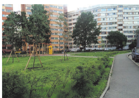
зона отдыха ул. Пионерстроя, д.7, кор.1-2

Завершаются работы по текущему ремонту проездов по адресам: ул. Л. Пилутова, д.11 кор.4 и ул. Пионерстроя, д.12 кор.2.