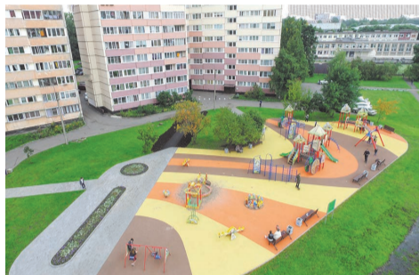
ул. Пионерстроя, д.7 кор.1-2

Также завершено устройство детской площадки, расположенной по адресу: ул. Пионерстроя, д.7 кор.1-2. На данном объекте выполнена укладка искусственного покрытия площадью 744,0 м 2 , устроен зеленый газон 1 200,0 м 2 . Площадка смотрится очень ярко и нарядно.