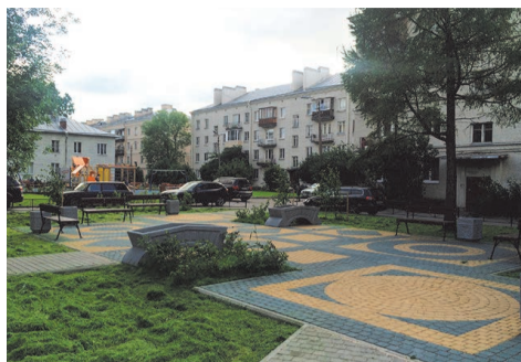
зона отдыха ул. Пограничника Гарькавого, д.6 кор.1-2

Также завершено устройство детской площадки, расположенной по адресу: ул. Пионерстроя, д.7 кор.1-2. На данном объекте выполнена укладка искусственного покрытия площадью 744,0 м 2 , устроен зеленый газон 1 200,0 м 2 . Площадка смотрится очень ярко и нарядно.