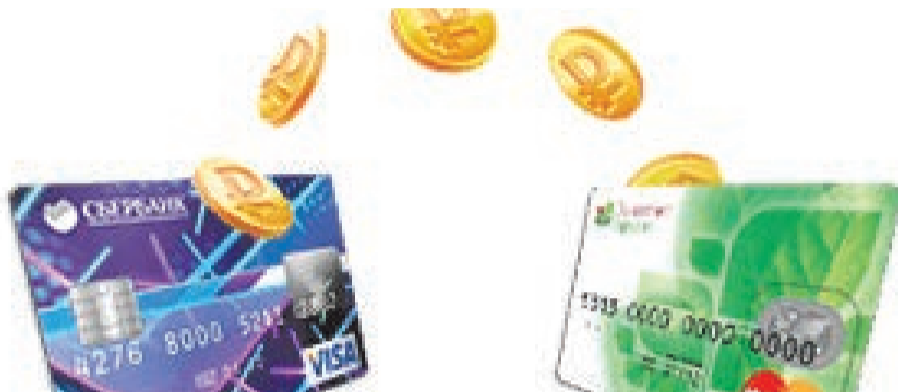
Перевод денег с карты на карту. Что нужно об этом знать?