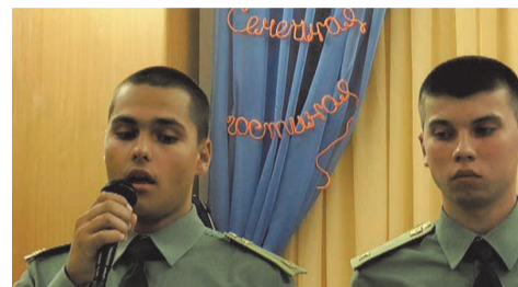
курсанты военного института