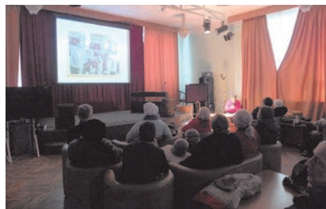
кинолекторий в кинотеатре «Восход»

Большой популярностью пользовался кинолекторий в кинотеатре «Восход», где раз в месяц жителям демонстрировались лучшие киноленты из советской и российской киноклассики.