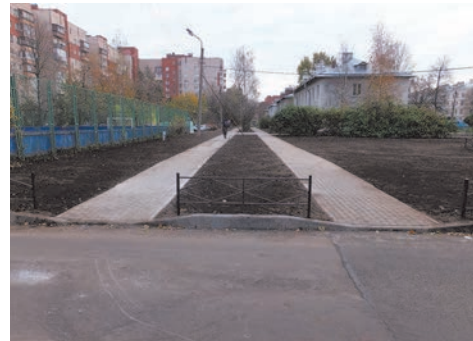
ул. Чекистов, д.38

Летом прошлого года была приведена в порядок территория внутриквартального озеленения по адресу: ул. Пионерстроя, д.21 к.2-д.23. Для комфорта наших жителей на данной территории выполнены устройство зоны отдыха с установкой уличных диванов, устройство пешеходной дорожки и цветника, восстановление газона.