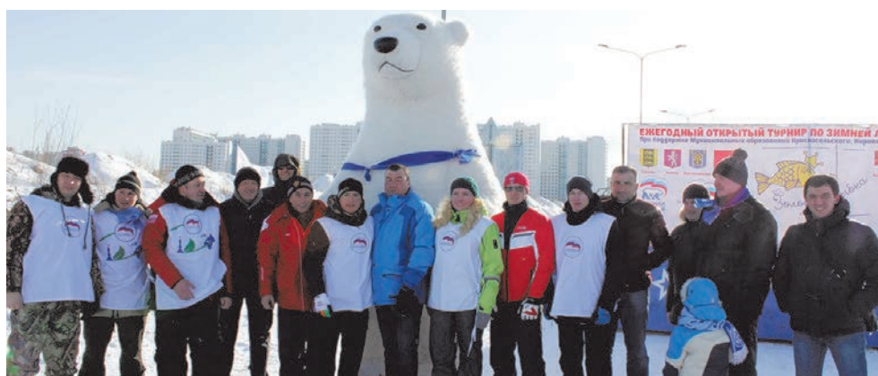
Турнир по зимней ловле рыбы «Золотая рыбка»

ПЕЧАТНЫЙ ОРГАН МУНИЦИПАЛЬНОГО СОВЕТА МО СОСНОВАЯ ПОЛЯНА