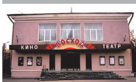
Переоборудование кинотеатра «Восход»

В марте кинотеатр «Восход» начнет показывать обновленный репертуар. В прошедшем году Комитет по культуре Правительства Санкт-Петербурга профинансировал переоснащение кинотеатра «Восход», отмечающего свое 55-летие. В данный момент в кинотеатре завершены работы по установке новейшего оборудования.