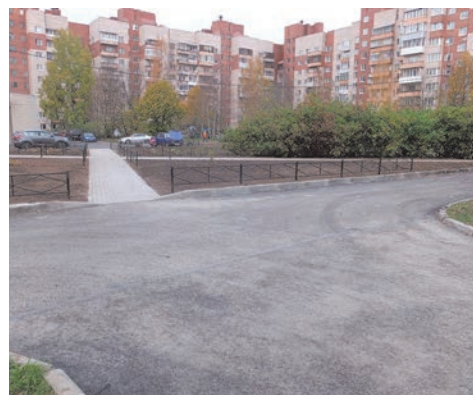
ул. Чекистов, д.38

Значительный объем работ выполнен в сентябре 2016 года по адресу: ул. Чекистов, д.38 - на сумму 12 100,0 тыс. руб. По данному адресу были выполнены текущий ремонт асфальтобетонного покрытия, установка газонного ограждения, устройство пешеходных дорожек в тротуарной плитке, посадка кустарника.