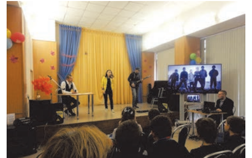
учебный тренинг по профилактике правонарушений

В дополнение к этому в школах округа были проведены учебные тренинги по профилактике правонарушений.