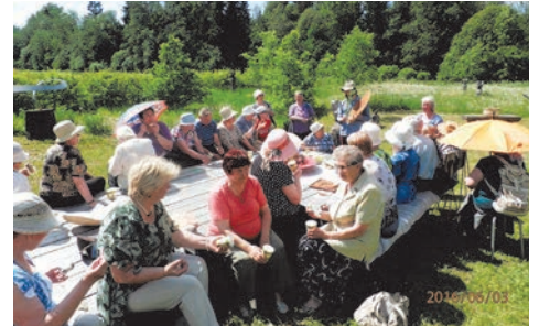
экскурсия «Копорский чай»

Наше старшее поколение побывало на экскурсиях в Константино-Еленинском монастыре в Зеленогорске и в усадьбе Марьино. Немало восторгов собрали экскурсии в Кингисепп и Ивангород, в закулисье Александринского театра, экскурсия по Санкт-Петербургу «Золотые купола». Летом наши жители отдохнули на озере Безымянном в Красном Селе и съездили на сельско-хозяйственную экскурсию «Копорский чай».