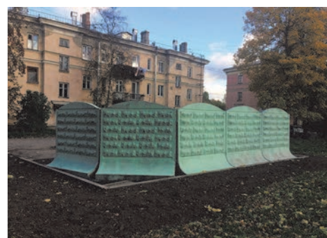
ул. 2-ая Комсомольская, д.17

Для придания опрятного и эстетичного вида нашим дворам мы выполнили работы по оборудованию контейнерных площадок на сумму 828,0 тыс. руб. по следующим адресам: - ул. Летчика Пилютова, д.32; - ул. Летчика Пилютова, д.36; - ул. Летчика Пилютова, д.10; - ул. 2-ая Комсомольская, д.17; - ул. П.Гарькавого, д.23 к.2.