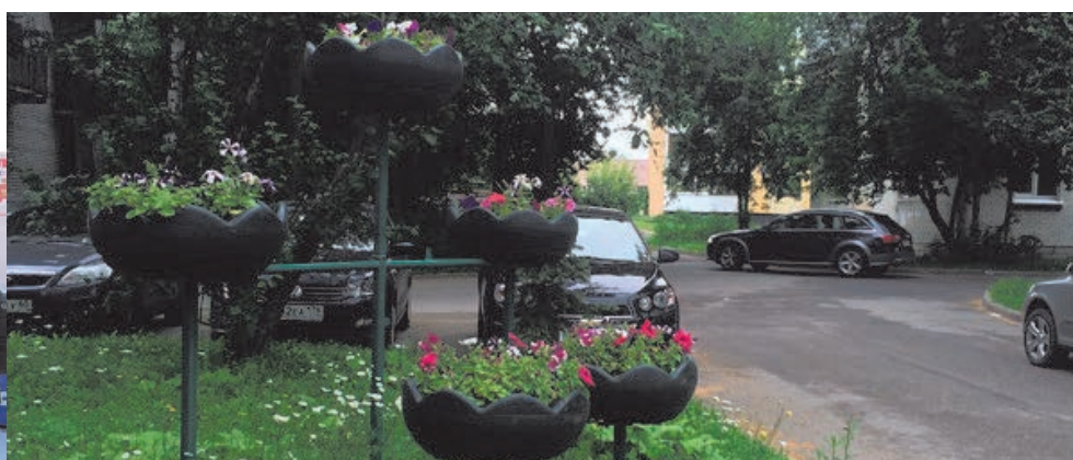
Отчет об исполнении бюджета МО СОСНОВАЯ ПОЛЯНА за 2016 год