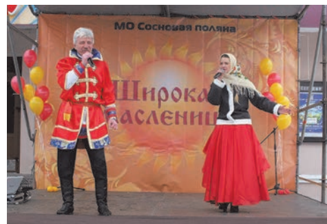
Масленица у кинотеатра «ВОСХОД»

Жители нашего округа с удовольствием участвовали в различных конкурсах и спортивных состязаниях. Для детей и взрослых были заготовлены самые разные конкурсы: каждый мог попробовать испечь импровизированный блин на сковороде, поучаствовать в рыцарском