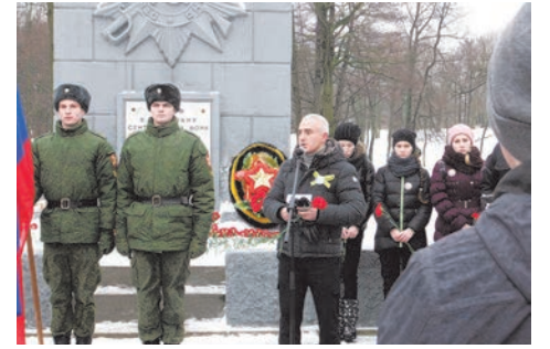
митинг у Ордена и «Лыжня памяти»

- устроили лыжный пробег по парку в память о тех событиях.