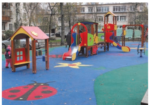
ул. П. Гарькавого, д.26 к.1

По инициативе муниципального образования появилась яркая и нарядная детская площадка для малышей по адресу: ул. П. Гарькавого, д.26 к.1. На искусственном покрытии этой площадки изображены радующие глаз цветы и божьи коровки. Стоимость работ составила 2 760,0 тыс. руб.