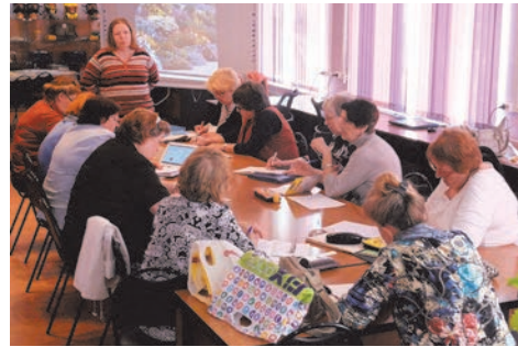
курсы по ландшафтному дизайну

Не меньшей популярностью в течение года пользовались и курсы по ландшафтному дизайну и карвингу. В июне 2016 года выпускники курсов по ландшафтному дизайну и другие жители Сосновой Поляны приняли активное участие в закладке аллеи «Созерцание и долголетие», где помимо цветов и кустарников появи-