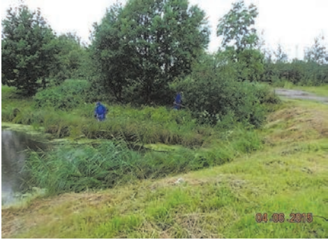
покос травы ул. Пионерстроа д.29