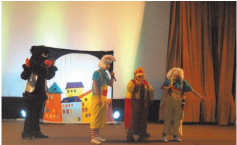
спектакль по ПДД

Спектакли по профилактике детского дорожно-транспортного травматизма, прошедшие в сентябре прошлого года, посмотрели более 600 юных пешеходов Сосновой Поляны.