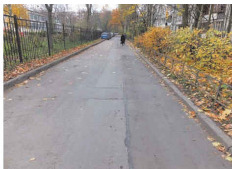
пр. Ветеранов, д.151 к.2

Забывая об автомобилистах нашего округа, мы выполнили работы по устройству дополнительных парковочных мест по адресу: ул. Здоровцева, д.10. Стоимость работ составила 660,0 тыс. руб.