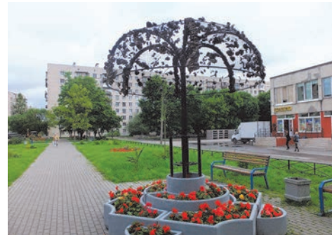
пр. Ветеранов, д.149

Для придания опрятного и эстетичного вида нашим дворам мы выполнили работы по оборудованию контейнерных площадок на сумму 828,0 тыс. руб. по следующим адресам: - ул. Летчика Пилютова, д.32; - ул. Летчика Пилютова, д.36; - ул. Летчика Пилютова, д.10; - ул. 2-ая Комсомольская, д.17; - ул. П.Гарькавого, д.23 к.2.