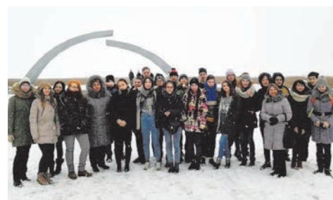
экскурсия на «ДорогуЖизни»

Автобусные поездки с возложением венков на «Дорогу Жизни» и к памятнику воинов-интернационалистов;