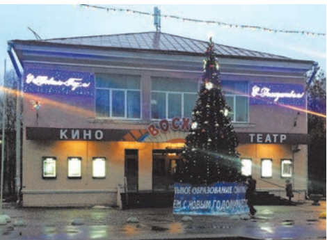
ул. Пограничника Гарькавого, д.22 к. 1

В первой декаде декабря 2016 года было выполнено праздничное оформление территории к Новому году: две пушистые ели радовали глаз жителей на ул. Пограничника Гарькавого, д.22 к. 1 и в посёлке Ленино.