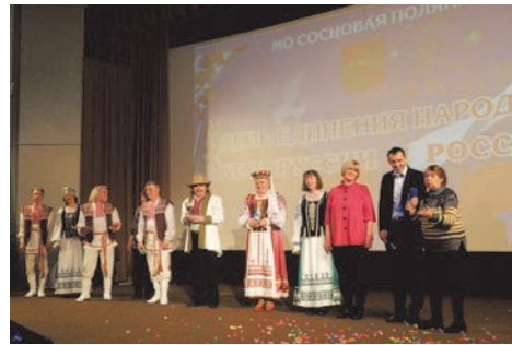
день единения России и Белоруссии

В апреле прошлого года на сцене кинотеатра «Восход» состоялся праздник единения России и Белоруссии с раздачей любившихся жителям округа драматических.