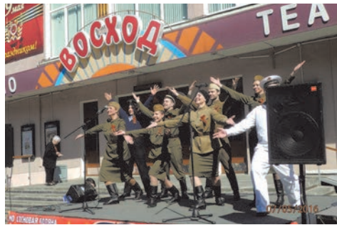
народные гуляния ко Дню Победы

Концерты, приуроченные к памятным датам (на День Победы, к 8 марта), также привлекли немалое внимание наших дорогих пенсионеров.