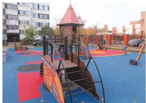
ул. Тамбасова, д.6 к.1