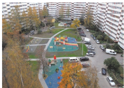
ул. Тамбасова, д.2 к.1

В августе прошлого года мы выполнили устройство тренажёрной и детских площадок с искусственным покрытием по адресу: ул. Тамбасова, д.2 к.1-к.2. Основная цель выполнения работ по данному адресу - игры и занятия спортом на свежем воздухе. На данном объекте также выполнены работы по устройству сети пешеходных дорожек в тротуарной плитке, устройство газона, посадка кустарника. Стоимость работ составила 8 100,0 тыс. руб.