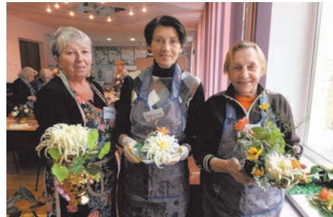
курсы по карвингу

лась новая культурная доминанта округа – скульптурная композиция «Цветочный фонтан».