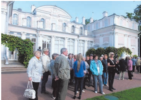
экскурсия в Китайский дворец в Ораниенбауме

Для лиц старшего возраста были организованы четыре экскурсии в Китайский дворец в Ораниенбауме, четыре экскурсии в Большой дворец в Гатчине и четыре экскурсии в Ратную Палату в Пушкине.