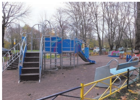
ул. Чекистов, д.44.

В III квартале 2016 года выполнен большой объем работ по текущему (ямочному) ремонту асфальтобетонного покрытия на сумму 2 000,0 тыс. руб.