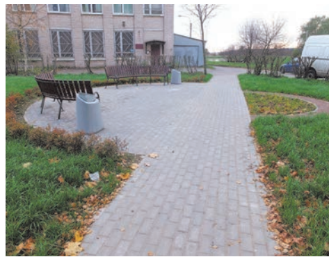
устройство зоны отдыха ул. Пионерстроя, д.21 к.2

Летом прошлого года была приведена в порядок территория внутриквартального озеленения по адресу: ул. Пионерстроя, д.21 к.2-д.23. Для комфорта наших жителей на данной территории выполнены устройство зоны отдыха с установкой уличных диванов, устройство пешеходной дорожки и цветника, восстановление газона.