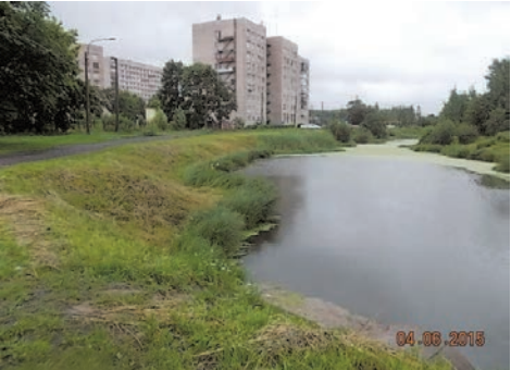
уборка акватории ул. Пионерстроа д.29

В первой декаде декабря 2016 года было выполнено праздничное оформление территории к Новому году: две пушистые ели радовали глаз жителей на ул. Пограничника Гарькавого, д.22 к. 1 и в посёлке Ленино.