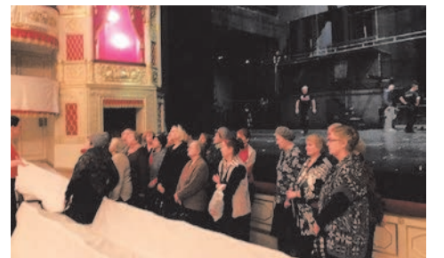
экскурсия в Александринский театр