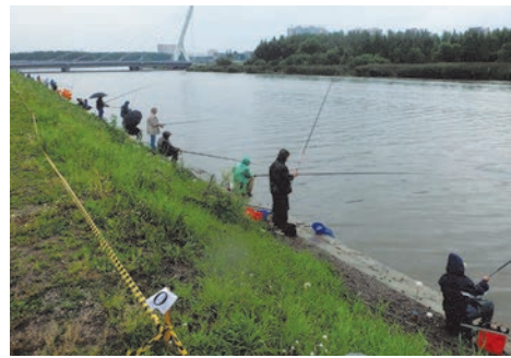
открытый турнир «Золотая рыбка»

канале. После соревнований участники дружно выпустили в канал мальков для увеличения рыбной популяции.