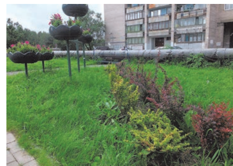
пр. Ветеранов, д.149

С заботой о красоте нашего округа во II квартале 2016 года были выполнены работы по закупке и посадке кустарника на пешеходной зоне, расположенной по адресу: пр. Ветеранов, д.149.