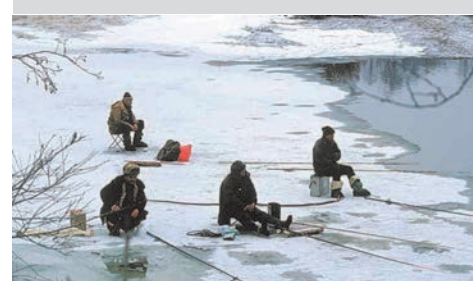
Безопасность зимней рыбалки

Основными причинами человеческих жертв на водоемах в зимнее время является пренебрежение элементарными правилами безопасности. Это увлечение может закончиться бедой, если забыть об опасности.