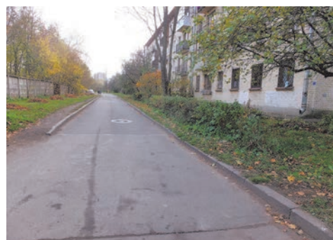
ул. П. Гарькавого, д.20 к.5

Представляем вам некоторые адреса: - ул. П. Гарькавого, д.20 к.5; - ул. Пионерстроя, д.12/3; - пр. Ветеранов, д.147/2; - пр. Ветеранов, д.149; - пр. Ветеранов, д.149-д.151 к.1; - пр. Ветеранов, д.153; - пр. Ветеранов, д.151 к.2; - ул. Летчика Пилютова, д.14; - ул. Летчика Пилютова, д.10-д.12.