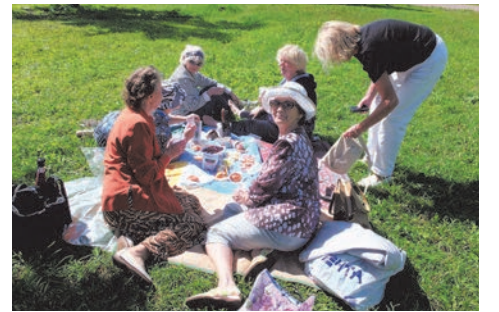
поездка на озеро Безымянное