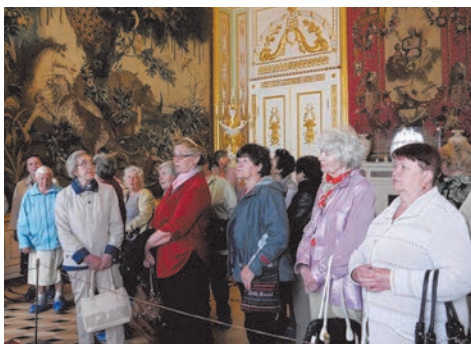
экскурсия в Гатчину

Народные гуляния «Широкая масленица» и в ознаменование Дня Великой Победы состоялись на площади перед кинотеатром Восход.