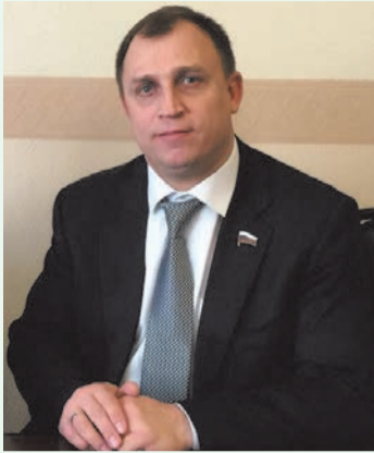
Депутат Государственной Думы РФ Сергей ВОСТРЕЦОВ

Доброго здоровья, счастья, благополучия Вам и вашим близким!