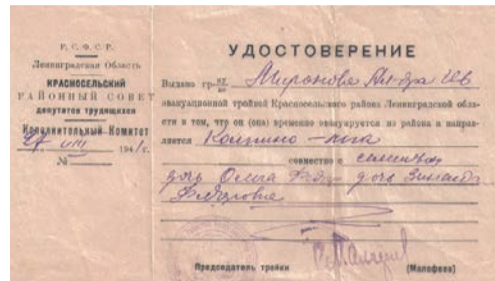
направление в эвакуацию