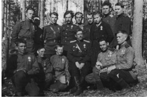
в лесу прифронтовом

светила... особенно после одного случая... Однажды в 3 часа ночи я бежал через какое-то поле с секретным приказом. Когда я уже почти дошел, выглянула луна, смотрю: табличка с немецкой надписью: «MINEN!». Когда я пошел обратно, глаза мои были, как у быка: эти мины я искал везде и шел предельно осторожно, делая большие круги вокруг опасных мест. Этот переход до сих пор помню. А тогда подумал: «Спасибо, боже, что ты меня уберег! Значит, я нужен на этой войне...».