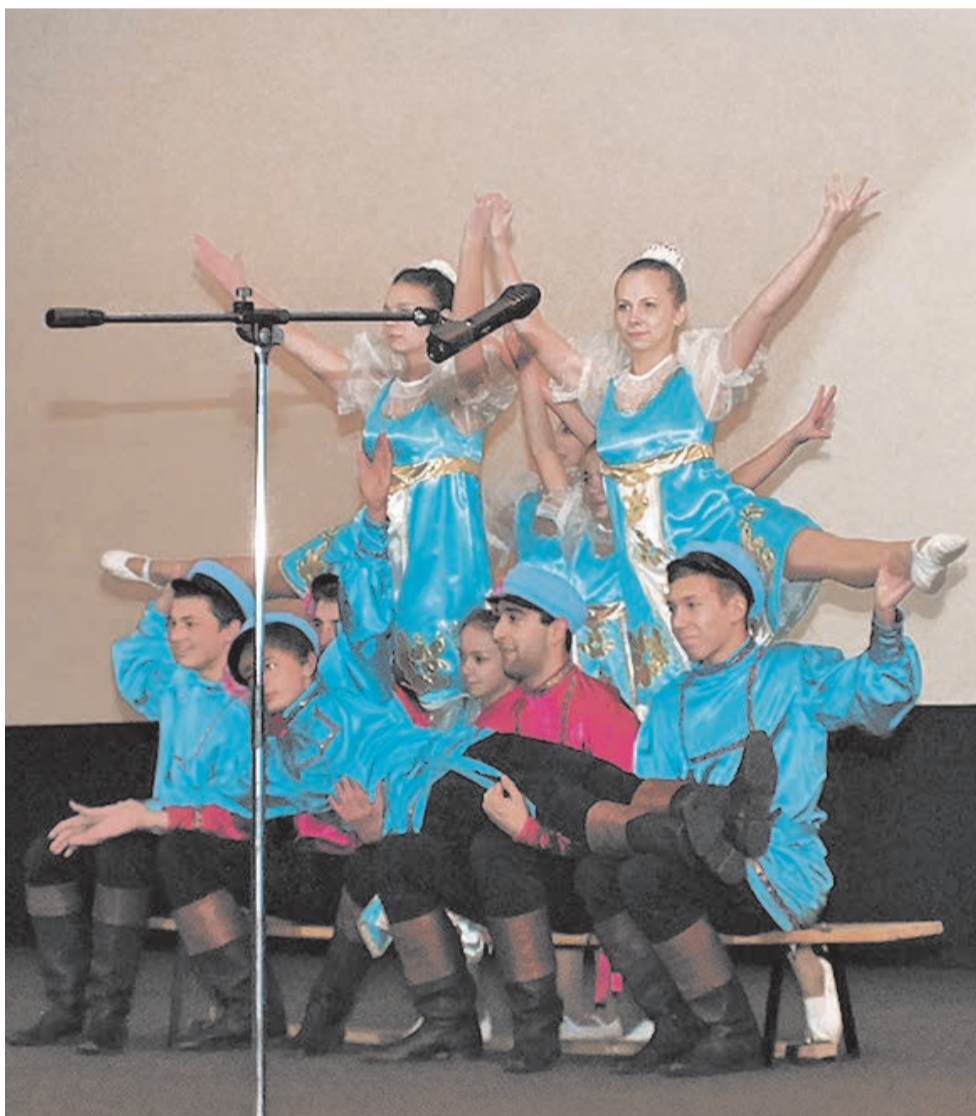
учащиеся Центра образования №167