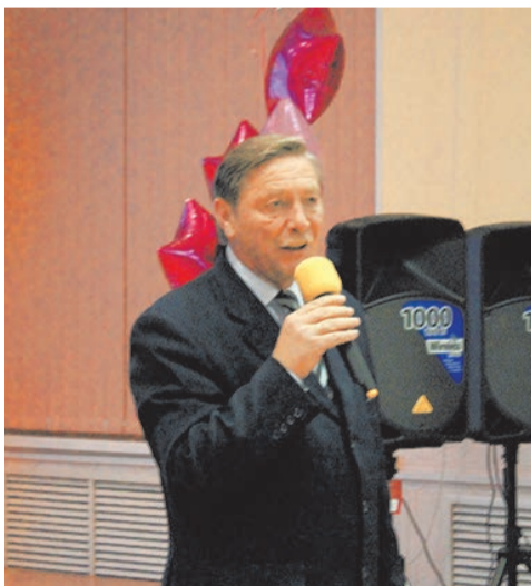
Член Правительства Санкт-Петербурга – глава Администрации Красносельского района на юбилее Лицея