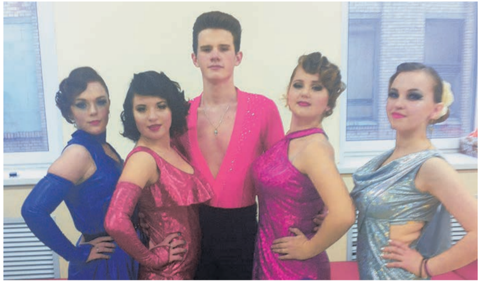
учащиеся Академии индустрии красоты «Локон»

Академия индустрии красоты «Локон» уже в шестой раз провела традиционный фестиваль «Дружба без границ», посвященный международному дню толерантности. Чтобы рассказать об особенностях стран, участники фестиваля выбрали нетрадиционный способ: конечно, что лучше традиционных костюмов, обычаев и народного творчества сможет передать культуру страны?