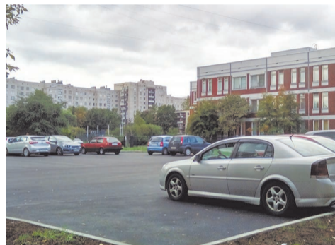
пр. Ветеранов д.149

по адресу: пр. Ветеранов д.149 выполнено устройство разворотной площадки из асфальтобетона, восстановление газона, посадка деревьев;