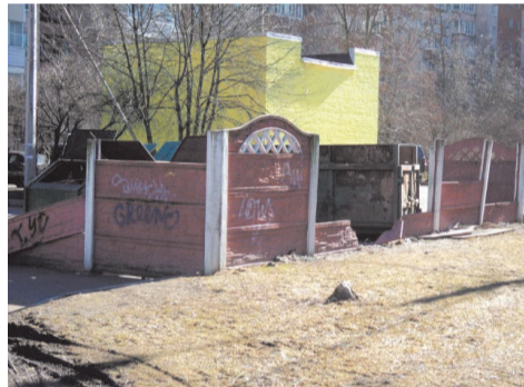
ул. Чекистов д.38 БЫЛО