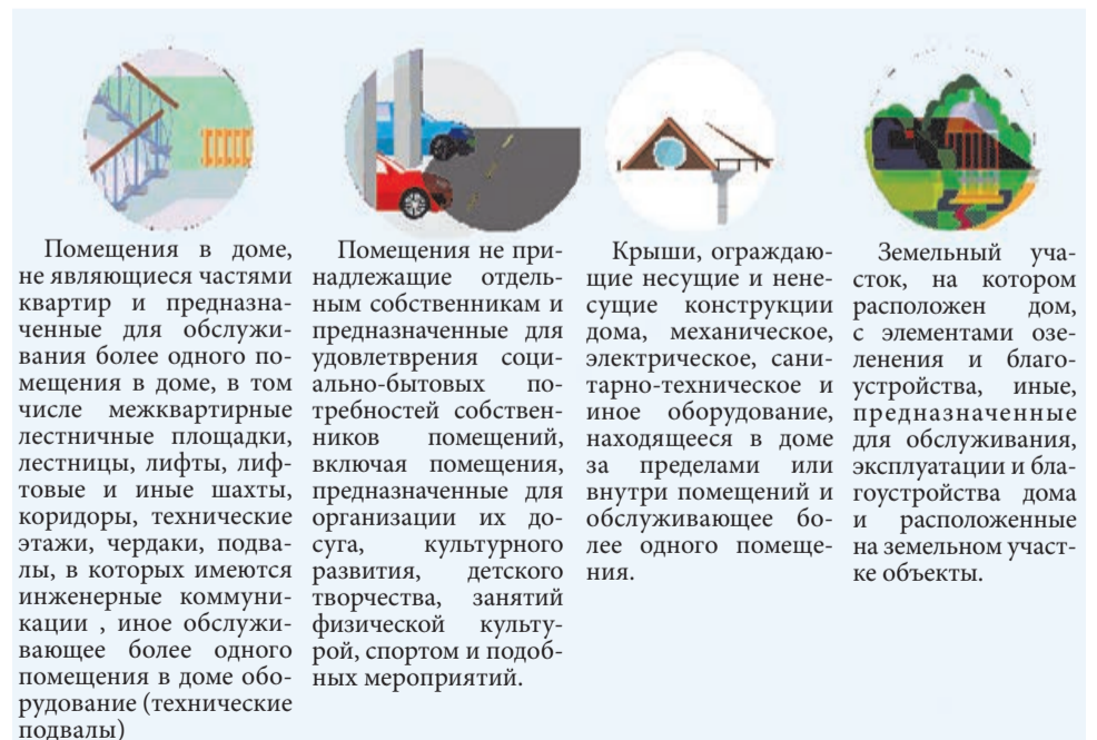
Схема «Общее имущество в многоквартирном доме»*