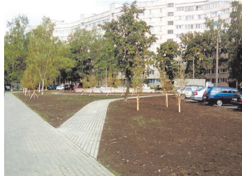
ул. Пионерстроя д.15 к.3

ходных дорожек из тротуарной плитки; устройство уширения асфальтобетонного проезда; восстановление газона; посадка деревьев и кустарников; устройство цветника;