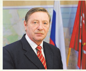
Евгений НИКОЛЬСКИЙ член Правительства Санкт-Петербурга - глава администрации Красносельского района Санкт-Петербурга