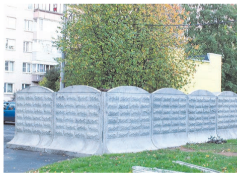
ул. Чекистов д.38 СТАЛО