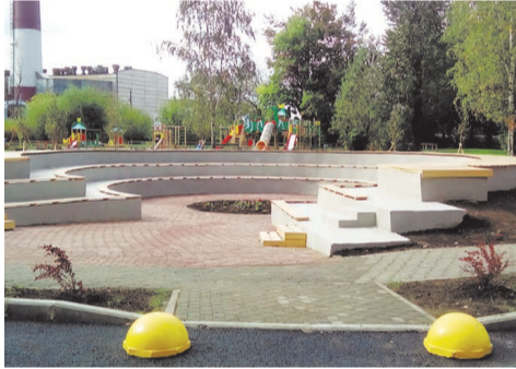
ул. Пионерстроя д.15 к.3 СТАЛО

устройство лестницы, устройство круговых ступеней зоны отдыха, монтаж деревянного настила из досок лиственницы; устройство пеше-