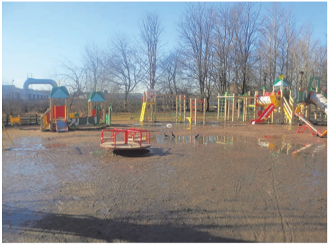
ул. Пионерстроя д.15 к.3 БЫЛО

по адресу: ул. Пионерстроя д.15 к.3 выполнено устройство площадки для отдыха с устройством покрытия из тротуарной плитки, устройство лестницы;