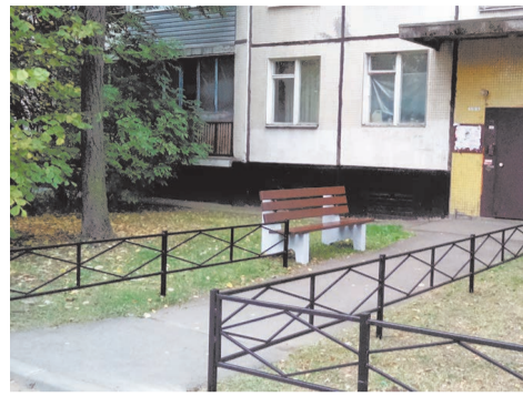
ул. Пионерстроя д.10 к.3

- ул. П. Гарькавого д.1; - Петергофское шоссе д.84 к.9,11, д.90 к.1.