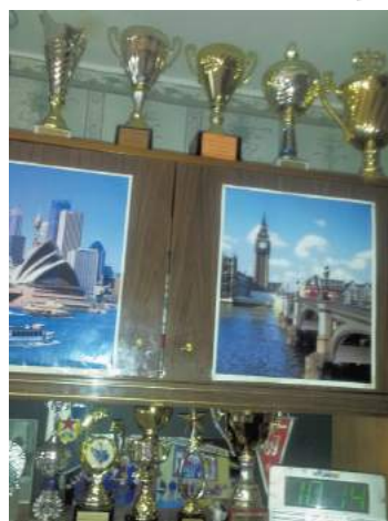
Часть коллекции наград

Однажды ребят пригласили в Америку на 14 дней. В первый день сыграли две игры и выиграли обе: первая игра – 15:3 в пользу наших! Америка насторожилась: как это – на тяжелых коньках, в плохой форме, уставшие, сменившие временной пояс и выиграли в первый же день?!!