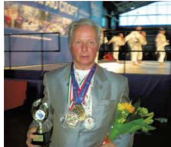
На спортивном празднике «Мы выбираем спорт». 2017 г.