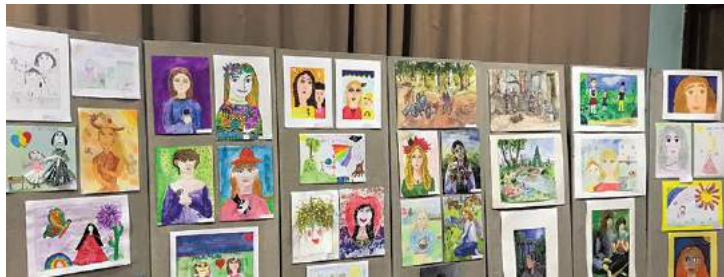
Ежегодный конкурс-выставка «Пусть всегда будет мама»

ПЕЧАТНЫЙ ОРГАН МУНИЦИПАЛЬНОГО СОВЕТА МО СОСНОВАЯ ПОЛЯНА