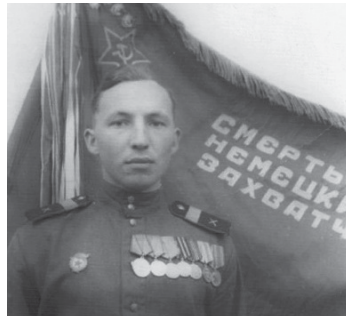
У боевого знамени части. 1948 г.