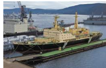
Атомный ледокол «Ленин» на вечном приколе в Мурманске

А его родной завод строил и строил... С 3 июля 1941-го в течение месяца завод переоборудовал самоходные грунтоотвозные шаланды в канонерские лодки. В сентябре 41-го был подписан приемный акт на несколько подводных лодок. В конце 42-го завод сдал флоту еще несколько подлодок, строил бронекатера и малые охотники.