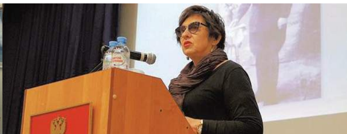
XVI Историко-краеведческая конференция «Люди и судьбы Красносельского района»