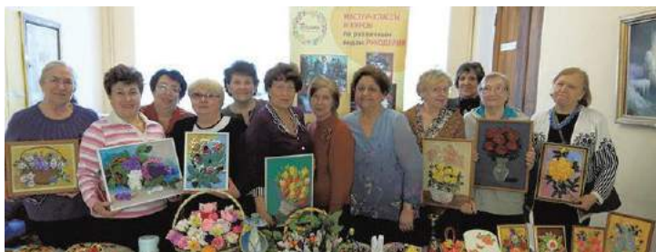
Активное долголетие в клубе «Полянка»

ПЕЧАТНЫЙ ОРГАН МУНИЦИПАЛЬНОГО СОВЕТА МО СОСНОВАЯ ПОЛЯНА