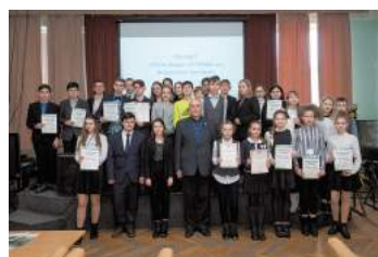
Конференция «Чистое сегодня – здоровое завтра»

Силами муниципального образования СОСНОВАЯ ПОЛЯНА в этом году были организованы две конференции «Чистое сегодня – здоровое завтра». Ученики общеобразовательных школ с интересом слушали профессоров экологических университетов и сами выступали с докладами на такие темы, как сортировка твердых бытовых отходов, очистка воды и многое другое.