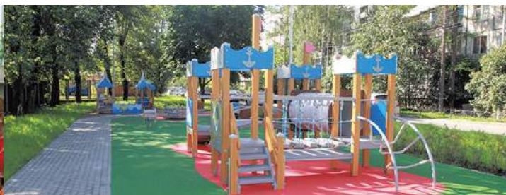
Завершаем сезон благоустройства в 2019 году