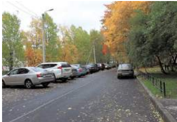
Ул. Тамбасова д.8, корп.2, ремонт проездов, установка газонных ограждений

- Вдоль домов №8 корп. 1, 2, 3 и 4 по ул. Тамбасова произведен текущий ремонт асфальтобетонного покрытия проездов, общей площадью 5 194,8 кв. м, а у дома №8 корп. 2 по ул. Тамбасова, помимо ремонта проездов, выполнены работы по ремонту подходов к парадным и газонов, а также установлено новое газонное ограждение, скамейки, урны и антипарковочные столбики.