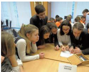
Викторина «Ленинградская победа»

Второй год подряд в детской библиотеке «Радуга» для подростков нашего округа была организована викторина по станциям «Ленинградская победа». Ребята смогли посмотреть архивный материал по блокадным будням и узнать детали исторических событий тех дней. Ведущие рассказали о том, как жил и трудился город в те суровые 900 дней. В качестве жюри были приглашены представители общества жителей блокадного Ленинграда. После викторины состоялся концерт, посвященный Дню полного освобождения Ленинграда от фашистской блокады.