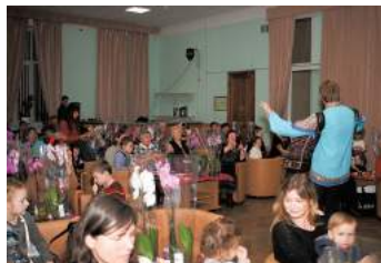
Праздничное мероприятие, посвященное Дню матери

Помимо этого прошло уже всем любимое праздничное мероприятие, посвященное Дню матери, куда были приглашены многодетные и одинокие мамы, бабушки и прабабушки нашего округа. Им был показан праздничный концерт, вручены благодарности и прекрасные орхидеи, как символ нежности и женственности.