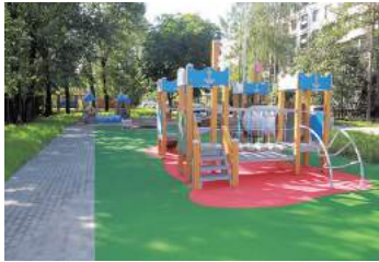
Ул. Пионерстроя дом №10 корп. 3

- Напротив дома №10 корп. 3 по ул. Пионерстроя были выполнены работы по устройству новой детской площадки с резиновым покрытием и установкой нового детского игрового оборудования, устройству пешеходной дорожки с покрытием из тротуарной плитки, установке газонного ограждения, ремонту газона и посадке кустарников.