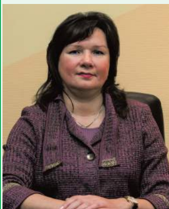
ГЛАВА МО СОСНОВАЯ ПОЛЯНА СВЕТЛАНА ДАВЫДОВА

Уважаемые жители муниципального образования СОСНОВАЯ ПОЛЯНА! Примите самые сердечные пожелания с наступающим 2020 годом и светлым Рождеством Христовым!