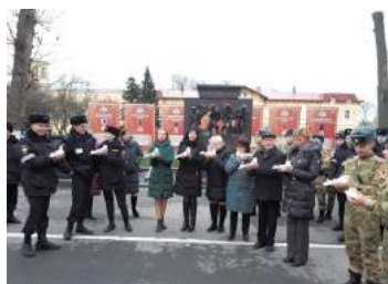
День памяти жертв «Беслана»

Для молодежи были организованы мероприятия по правовому просвещению и вопросам противодействия терроризму и экстремизму. Публичная акция «День памяти жертв Беслана» прошла на стадионе школы № 385