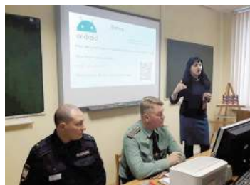
Круглый стол антитеррор

Круглый стол «Антитеррор-сегодня и вчера» состоялся в Санкт-Петербургском военном ордена Жукова институте войск национальной гвардии РФ на кафедре уголовного процесса и криминалистики.