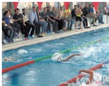
Турнир Дельфины России

В апреле месяце в бассейне «Атлантика» прошли соревнования по плаванию «Дельфины России». В первый день участие приняли жители округа от 10 до 17 лет, во второй день – от 18 и старше. В этом году 68 участников сдали нормы ГТО по плаванию. Все участники по завершении соревнований получили памятные призы и подарки.