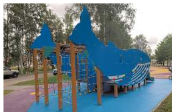
Петергофское шоссе д.90 корп. 1, установка детского игрового оборудования

- Завершены работы по благоустройству дворовой территории дома №90 корп. 1 по Петергофскому шоссе, начатые в 2018 году. На детской площадке указанного дома установлено новое детское игровое и спортивное оборудование.