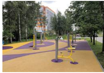
Петергофское шоссе д.90 корп. 1, установка спортивного оборудования