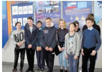
Посещение центра МЧС

Накануне 7 мая 150 школьников и жителей округа проществовали в колонне Бессмертного полка по проспекту Ветеранов, а в День Победы с песнями военных лет под баян, с транспарантами, которые изготовила Местная администрация МО СОСНОВАЯ ПОЛЯНА, прошли по Невскому проспекту. Мы ежегодно принимаем участие в этом масштабном и патриотическом мероприятии. Ветераны Великой Отечественной войны, труженики тыла, жители блокадного Ленинграда получили поздравления с праздником великой Победы от Главы МО и Местной администрации.