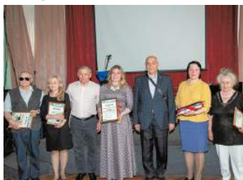
Конкурс стихов «Поэт Сосновой Поляны-2019»

Конкурс стихов «Поэт Сосновой Поляны-2019» определил лучших поэтов по различным номинациям, в том числе в номинации «Что такое толерантность?». Мероприятие оказалось популярным как среди старшего поколения нашего округа, так и среди молодежи.