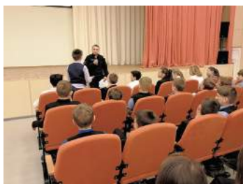
Наш мир без экстремизма и терроризма

В апреле в рамках мероприятия «Наш мир без экстремизма и терроризма» учащиеся школ округа посетили базу МВД, где подробно познакомились с подготовкой курсантов СПб УМВД России для службы в ОМОНе и спецназе: ребятам показали тир, полосу препятствий, спортзал. Были изготовлены видеосюжеты по профилактике терроризма и экстремизма для жителей МО, которые размещены на сайте Муниципального образования.