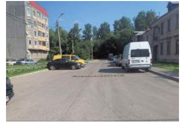
Петергофское шоссе, д.84, корп.8, установка искусственных дорожных неровностей

Кроме того, в 2019 году начаты работы по благоустройству сквера, расположенного между домами №84 корп. 8 и №88 корп. 2 по Петергофскому шоссе. В настоящее время завершены работы по устройству пешеходных дорожек и установке декоративного ограждения. В следующем году планируется завершить работы по устройству детских и спортивных площадок и озеленению территории, включающее устройство газонов, посадку деревьев и кустарников.