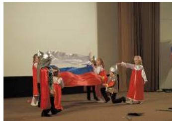
Конкурс солдатской песни

Шестой раз в кинотеатре «Восход» состоялся конкурс солдатской песни «Верны России». В этом году численность участников составила 180 человек. Среди них были воспитанники детских садов, учащиеся школ, детского дома творчества Красносельского района, подростковых клубов. В конкурсе прозвучали современные песни, песни военных лет, а также литературно-музыкальные композиции.