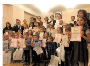
Конкурс-выставка художественных работ «Пусть всегда будет мама»

Более ста пятидесяти детей нашего округа от трех до восемнадцати лет приняли участие в ежегодном конкурсе-выставке художественных работ «Пусть всегда будет мама», организованном совместно с Детской школой искусств Красносельского района. Многие дети заняли призовые места в различных номинациях и получили художественные подарки.