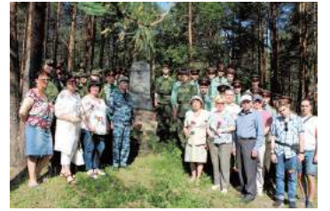
Поездка на заставу им. И. Коробицына

Накануне Дня пограничника состоялось посещение погранзаставы им. И.Коробицына возле Светогорска.