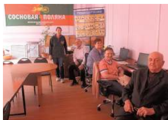
Обучение компьютерной грамотности

В 2019 году в муниципальном образовании СОСНОВАЯ ПОЛЯНА продолжил свою работу клуб «Полянка» для творческих лиц 55+. С января по декабрь более 60 человек обучились различным видам творчества: вышивка лентами, свит-дизайн, текстильная игрушка, скрапбукинг, карвинг и декупаж. На мастер-классах (амиту-