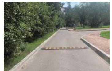
Тамбасова, д.4, корп.2, установка искусственных дорожных неровностей

По доброй традиции прошлых лет для создания праздничного настроения у на-