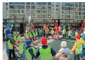
Мероприятия ко Дню защиты детей

Ко Дню защиты детей в этом году были организованы два мероприятия с веселыми аниматорами, музыкой, конкурсами и интересными подарками – в Солнечном городе и на 2-ой Комсомольской улице.