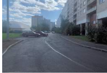
Ул. Тамбасова дом №4 корп. 2, ремонт проездов, устройство тротуара

- Напротив СПб ГБУ «Центр физической культуры, спорта и здоровья Красносельского района» вдоль дома №4 корп. 2 по ул. Тамбасова оборудован тротуар для безопасного прохода пешеходов по внутриквартальной территории с покрытием из асфальтобетона, общей площадью 295,6 кв. м.