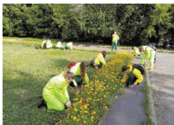
Летнее трудоустройство несовершеннолетних

Концерты, приуроченные к памятным датам (к 8 марта, на День Победы и к Ново-