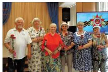
Литературно-музыкальная композиция ко Дню памяти 21 июня

Накануне Дня пограничника состоялось посещение погранзаставы им. И.Коробицына возле Светогорска.