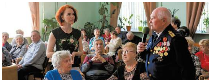
Организация и проведение мероприятий для жителей Сосновой Поляны в 2019 году

ПЕЧАТНЫЙ ОРГАН МУНИЦИПАЛЬНОГО СОВЕТА МО СОСНОВАЯ ПОЛЯНА