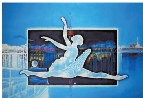
Балет над Невой

– В Можайке строгая дисциплина. Мы жили в казармах, и в шесть вечера начинался развод суточного наряда. А я был всегда заядлым болельщиком «Зенита». В дни матчей брал с собой маленький телевизор, который помещался в обычном портфеле. После построения садился за стол и смотрел футбол. Понимая, что нарушаю распорядок, я особо не светился и тихо болел: эмоции нельзя выплеснуть наружу! Ну и писал, конечно.