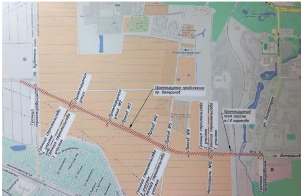
дорога на карте