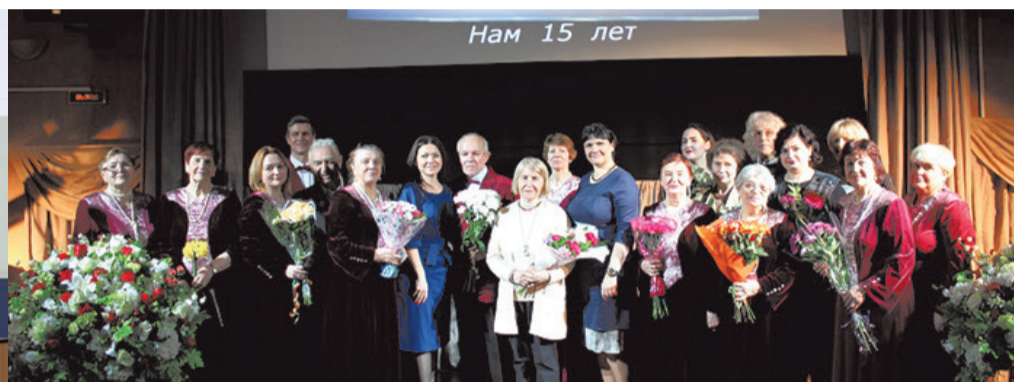
«Серебряный родник», с юбилеем!