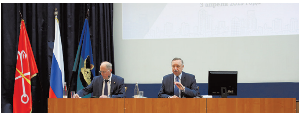
Действующий губернатор города посетил Красносельский район

ПЕЧАТНЫЙ ОРГАН МУНИЦИПАЛЬНОГО СОВЕТА МО СОСНОВАЯ ПОЛЯНА