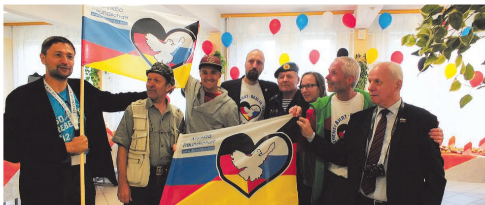
Автопробег мира посетил Сосновую Поляну

ПЕЧАТНЫЙ ОРГАН МУНИЦИПАЛЬНОГО СОВЕТА МО СОСНОВАЯ ПОЛЯНА