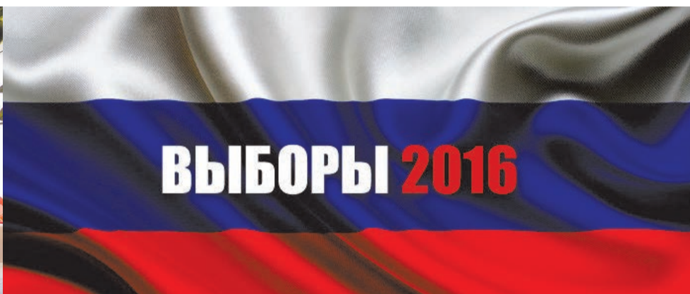
Избирательные участки МО СОСНОВАЯ ПОЛЯНА