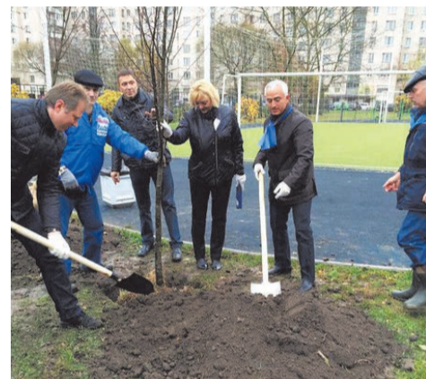
посадка лип на ул. Пионерстроя д.18

Для реализации идей экологизации сознания, создания условий становления экологически ориентированной экономики Партия Единая Россия запустила Федеральный инфраструктурный проект: «Экология России». Одной из целей проекта является повышение уровня экологического сознания населения.