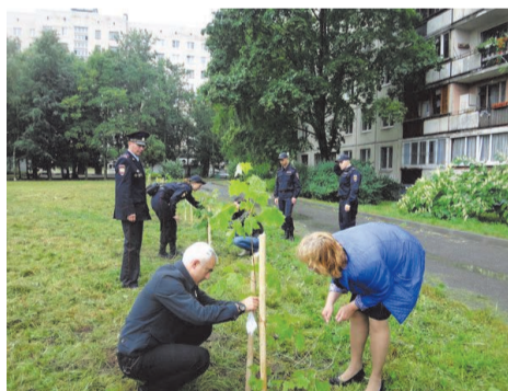
акция «Посади дерево!» на проспекте Ветеранов, д.149

В качестве самостоятельной науки экология оформилась лишь в XX в., хотя факты, составляющие ее содержание, с давних времен привлекали внимание человека. Большое значение экологии как науки по-настоящему стали понимать лишь недавно. Этому есть объяснение: усиливающееся воздействие человека на природную среду поставило его перед необходимостью решать ряд новых жизненно важных задач. Для удовлетворения своих потребностей в воде, пище, чистом воздухе человеку надо знать, как устроена и как функционирует окружающая его природа. Экология как раз и изучает эти проблемы.