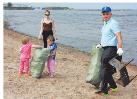
уборка прибрежной зоны Финского залива

Радует, что многие жители нашего муниципального образования не остаются безучастными к экологическим проблемам нашего района. Об этом свидетельствуют письменные и телефонные обращения граждан в приемную проекта «Экология России». Ни одно из обращений граждан не останется без ответа.