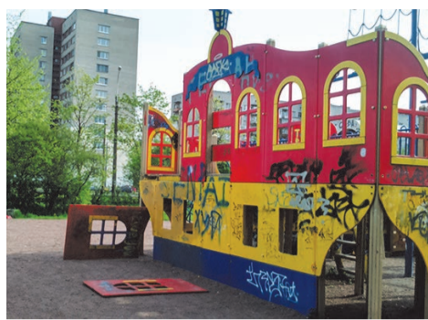
кому-то немало пришлось потрудиться, чтобы уничтожить красоту на детской площадке на пр.Ветеранов 133 к.2

Давайте задумаемся над природой вандализма. Вот его основные психологиче-