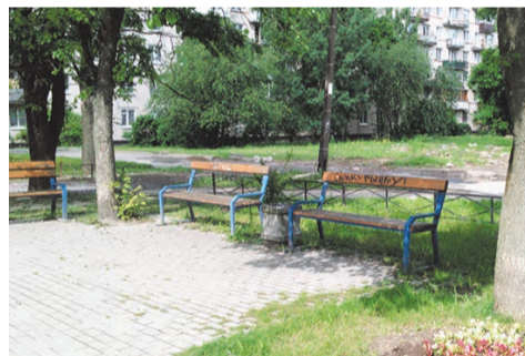
кому-то помешали скамейки на пр.Ветеранов, 147

Посмотрите на оторванную голову фигурки Красной Шапочки возле дома № 10 по улице Пограничника Гарькавого.