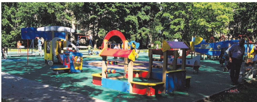
Летнее благоустройство на территории МО СОСНОВАЯ ПОЛЯНА в 2017 году

ПЕЧАТНЫЙ ОРГАН МУНИЦИПАЛЬНОГО СОВЕТА МО СОСНОВАЯ ПОЛЯНА