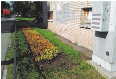
клумба на пр.Ветеранов 141, украдена часть цветов