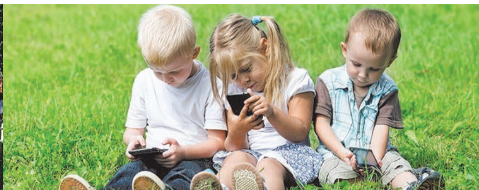
Мои дети все время сидят в телефоне и планшете