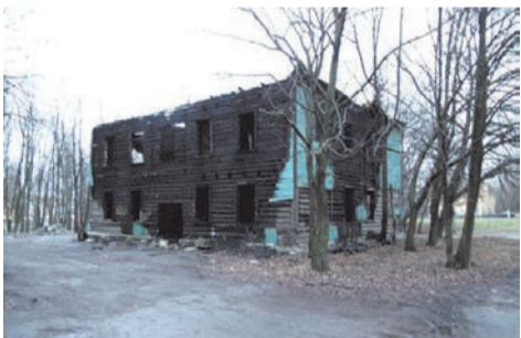
ул. Чекистов д.7

В отношении дома на ул. Чекистов д.3 в настоящее время администрацией Красносельского района по согласованию с Жилищным комитетом осуществляется перевод жилых помещений в нежилые помещения с целью дальнейшего рассмотрения вопроса о закреплении данного объекта за СПбГБУК «Централизованная библиотечная система Красносельского района».