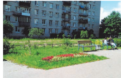
пешеходная зона и цветы пр.Ветеранов, д.147

Завершены работы по ремонту и установке искусственной дорожной неров-