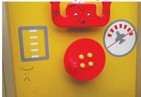
кто-то обновил новое оборудование детской площадки на ул.Летчика Пилютова д.19