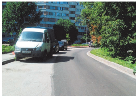
текущий ремонт асфальта ул.Пионерстроя, д.7 к 1-3

Завершены работы по ремонту детской площадки по адресу: ул. Пионерстроя, д.7 к.1-к.3.