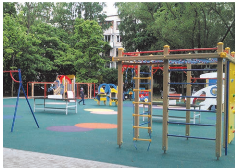
детская площадка ул. Летчика Пилютова, д.19

Выполнен текущий ремонт (ремонт картами) асфальтобетонного покрытия по 55 адресам.