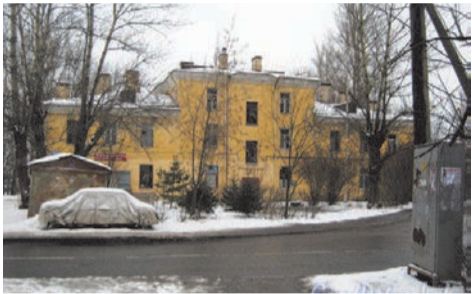
ул. Чекистов д.3

Лидия Терентьева, проживающая на ул. Чекистов д. 42 задает вопрос: «Интересна судьба дома №3 по ул. Чекистов (Усадьба П.Г.Демидова) и дома №7 по ул. Чекистов. Дома давно расселены, дом на Чекистов д. 7 разрушен. В зданиях постоянно вспыхивают пожары, и они представляют угрозу для населения. Какая судьба ждет эти здания?»