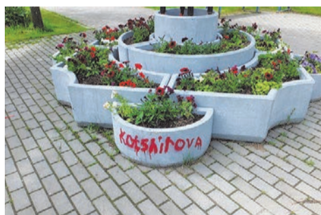
появились надписи на вазонах (зона отдыха на пр.Ветеранов, 147)

Об этом можно сказать и короче: у всех вандалов налицо комплекс неполноценности. А возникает он, как правило, у людей с низким культурным уровнем: не те книжки им в детстве читали. Да и читали ли? О самообразовании такие люди напрочь забыли. Какие чувства они вызывают у вас? Горечь? У многих из нас – презрение. Ущербные они какие-то.