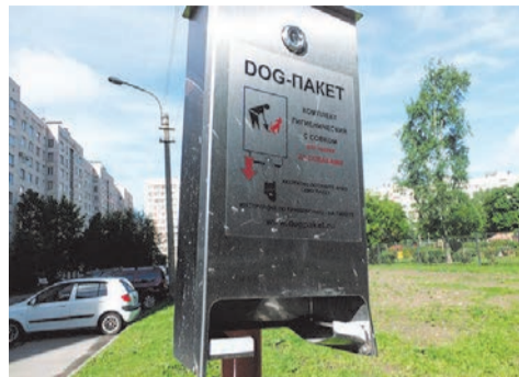
пустой диспенсор для дог-пакетов.

блорядочным владельцам собак. Увы, комментарии излишни.