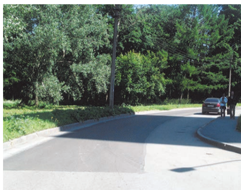
текущий ремонт асфальта ул.Пионерстроя, д.7 к 1-3

Выполнен текущий ремонт (ремонт картами) асфальтобетонного покрытия по 55 адресам.