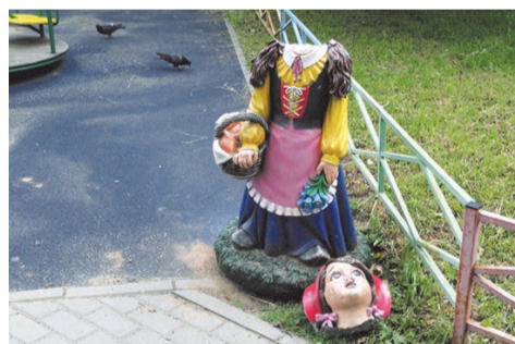
уничтоженная фигурка Красной Шапочки на ул.П. Гарькавого 10

Посмотрите на оторванную голову фигурки Красной Шапочки возле дома № 10 по улице Пограничника Гарькавого.