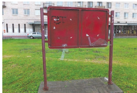
разбитый стенд на пр.Ветеранов, 155

Крадучись, по ночам, кто-то разрушает игровые площадки, созданные для наших детей – подумайте о них! Украдкой, исподтишка, кто-то разбивает или разрисовывает муниципальные стенды с нужной для горожан информацией. Озираясь, закрывая лицо капюшоном, кто-то с циничной радостью ломает скамейки и бьет стекла на остановках, которые защищают нас от ветра в ненастную пору.