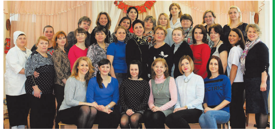
Родители воспитанников детского сада Депутаты Муниципального Совета, сотрудники Местной администрации МО СОСНОВАЯ ПОЛЯНА,

24 марта 2017 года детский сад №11 отмечает юбилей - 45 лет. Хочется поздравить весь коллектив во главе с заведующей и поблагодарить за теплую атмосферу, создаваемую вами. Благодаря вашему коллективу, детский сад для малышей стал вторым домом. Ваш профессионализм обеспечивает родителям спокойствие за своих чад. В стенах вашего учреждения всегда слышен радостный детский смех, а это прекрасно. С юбилеем!