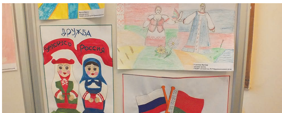
День единения народов России и Белоруссии

ПЕЧАТНЫЙ ОРГАН МУНИЦИПАЛЬНОГО СОВЕТА МО СОСНОВАЯ ПОЛЯНА