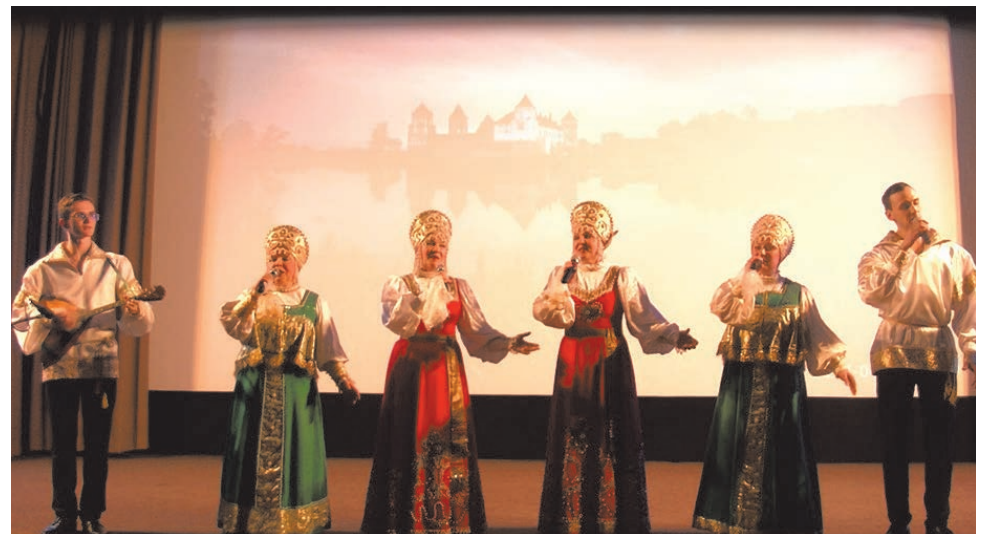
ансамбль народной песни «Отрада»

Далее выступили самые маленькие участники концерта - малыши из детского сада №45. Яркие, нарядно одетые дети представили публике танцы под традиционные белорусские композиции,