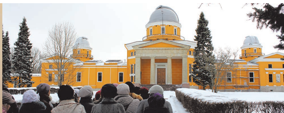
Звезды стали ближе