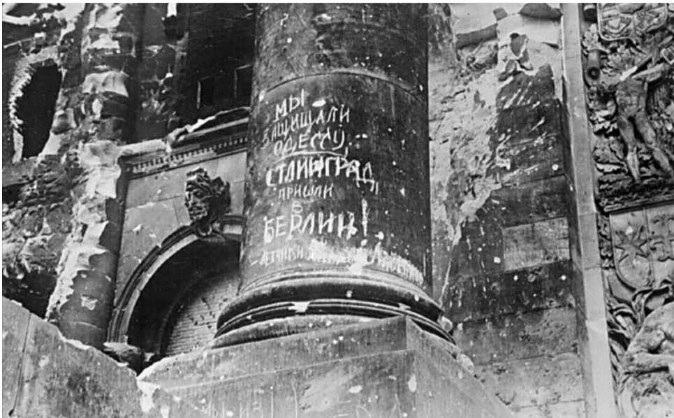
Надпись на Рейхстаге

Великий день, капитуляция нацистской Германии! И хотя война еще некоторое время продолжалась, пока Япония не получила Хиросиму и Нагасаки, для советских людей именно 9 мая стало окончанием Второй мировой. Поздравляем всех ветеранов с этим героическим подвигом. Помним, ценим, уважаем!