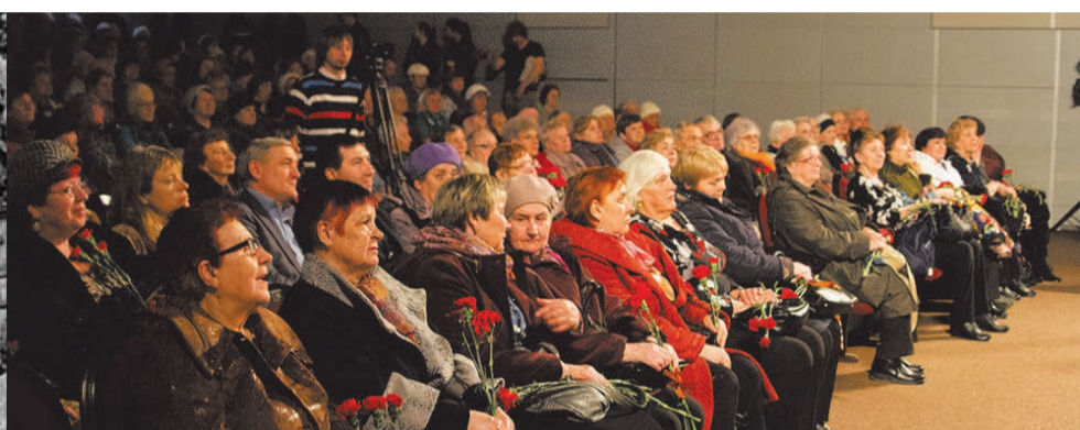
Праздничный концерт к 9 мая