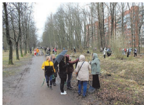
Парк за домом по ул. Чекистов, д.38

Заметно чище стала и территория напротив отделений социальной помощи семье и детям по адресу: 2-Комсомольская д. 3, к.2.