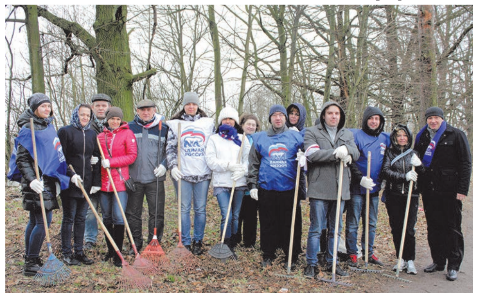
Представители МО СОСНОВАЯ ПОЛЯНА убирают территорию вдоль Петергофского шоссе