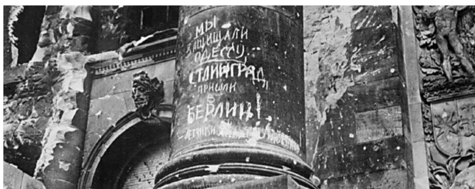
Праздник со слезами на глазах...

ПЕЧАТНЫЙ ОРГАН МУНИЦИПАЛЬНОГО СОВЕТА МО СОСНОВАЯ ПОЛЯНА