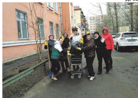
Территория за домом по ул. Чекистов, д.42

вания СОСНОВАЯ ПОЛЯНА. Несмотря на дождь, который сопровождал все мероприятие, участникам удалось собрать более двадцати мешков мусора. Присоединились к уборке и депутаты муниципального образования.