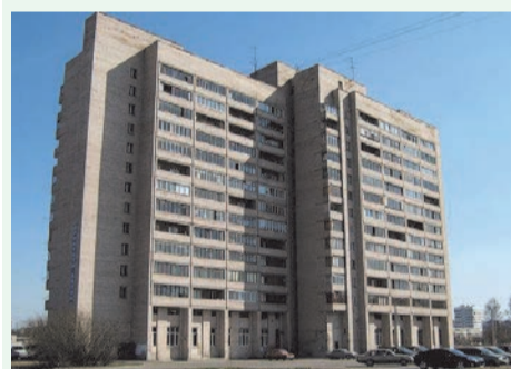
Площадка перед домом Чекистов д. 26

При пожаре звоните: 01 с городских или 112 с мобильных телефонов