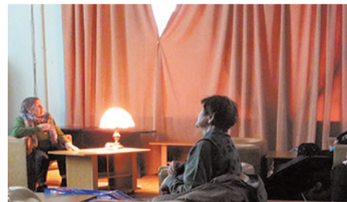
во время лекции

Некоторое время после окончания Ленинградского театрального института в 1953 году актриса проработала в ярославском театре имени Ф.Волкова, но после вернулась в Ленинград, где сначала 8 лет проработала в театре им. Ленинского комсомола, а затем обрела свой родной дом на сцене Александринского театра (рань-