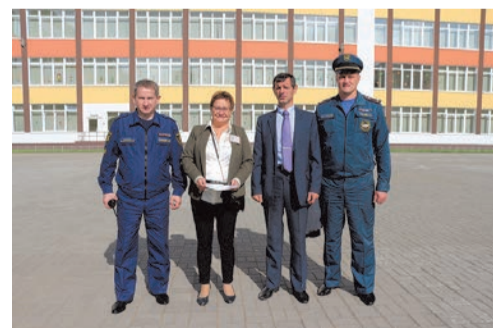
СПб ГКУ «ПСО Красносельского района» ОНДПР Красносельского района