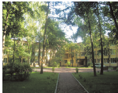
Центр образования №167

На территории муниципального образования СОСНОВАЯ ПОЛЯНА находит-