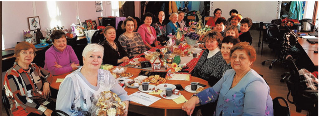
Организация и проведение мероприятий для жителей СОСНОВОЙ ПОЛЯНЫ в 2018 году