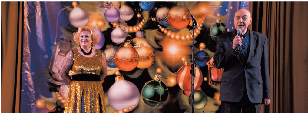
Коротко о главном в декабре

ПЕЧАТНЫЙ ОРГАН МУНИЦИПАЛЬНОГО СОВЕТА МО СОСНОВАЯ ПОЛЯНА