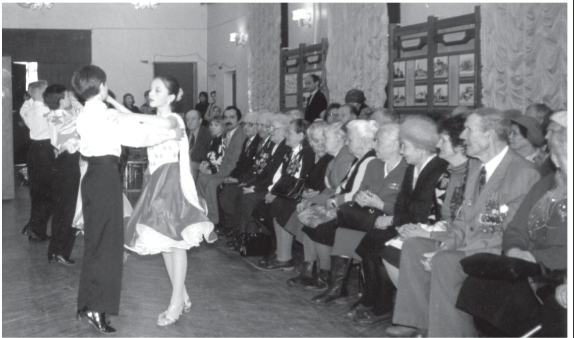
1999 год, ДДЮТ. Наше первое празднование Дня Победы

С 1999 года мы стали проводить концерты и вечера отдыха для жителей округа: День Победы, День пожилого человека... В проведении этих мероприятий нам очень помогли расположенные на нашей терри-