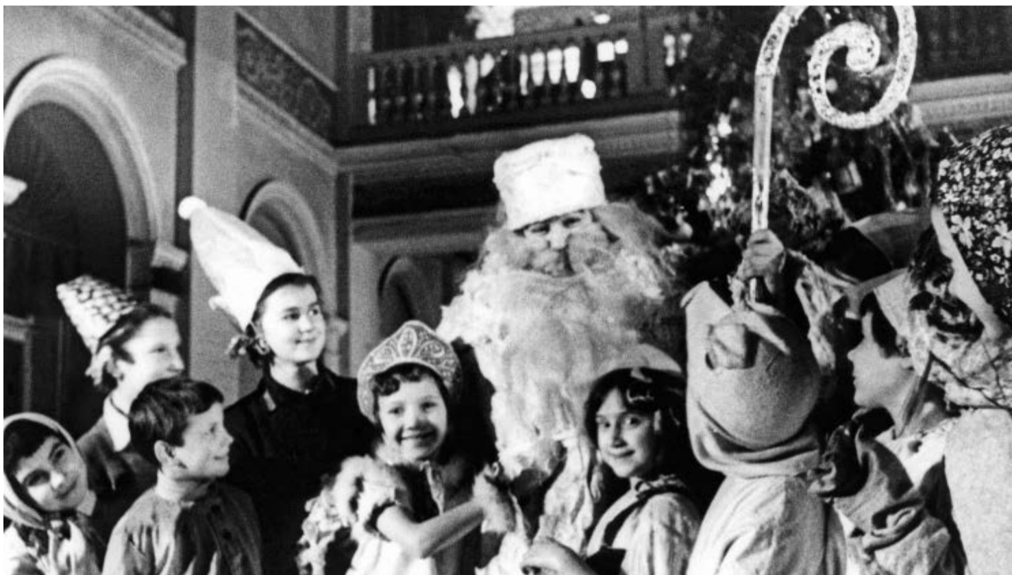
Блокадная новогодняя елка во Дворце пионеров

27 января мы отмечаем День полного освобождения советскими войсками города Ленинграда от блокады его немецко-фашистскими войсками. Самой страшной блокады в истории человечества.