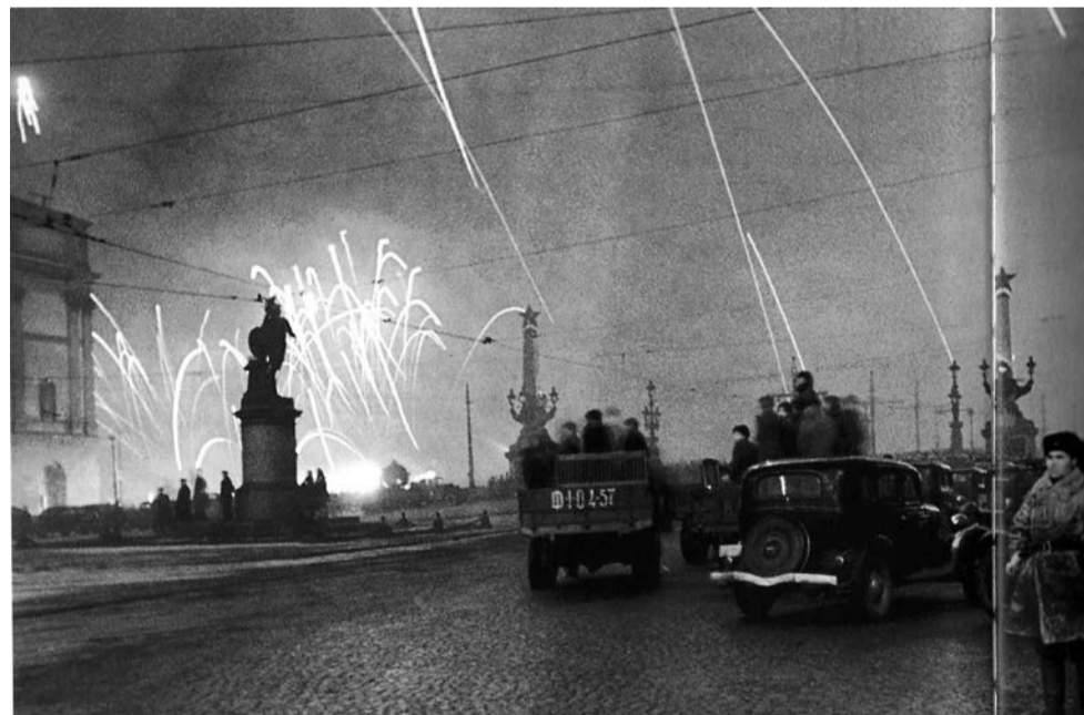
Салют в честь освобождения Ленинграда от блокады

Ленинградцы отмечали также Праздник Весны и Труда, который в Советском Союзе отмечали два дня – 1 и 2 мая. Люди устраивали субботники, по мере своих возможностей убирали улицы, сады, придомовые участки. Особенно торжественно его стали отмечать после войны. В послевоенное время на празднование Первая оказала влияние недавняя победа в Великой Отечественной войне. Тем бо-