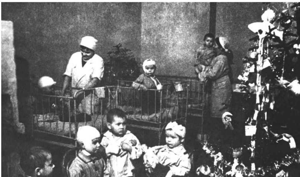
Елка в одной из больниц блокадного Ленинграда

Январь 1944 года принес ленинградцам долгожданную весть – поздно вечером 27-го числа стало известно о полной ликвидации вражеского кольца. Город выстоял. И теперь, к многочисленным праздникам в Ленинграде прибавился ещё один, который вот уже 70 лет является олицетворением мужества, силы, храбрости всего русского народа.