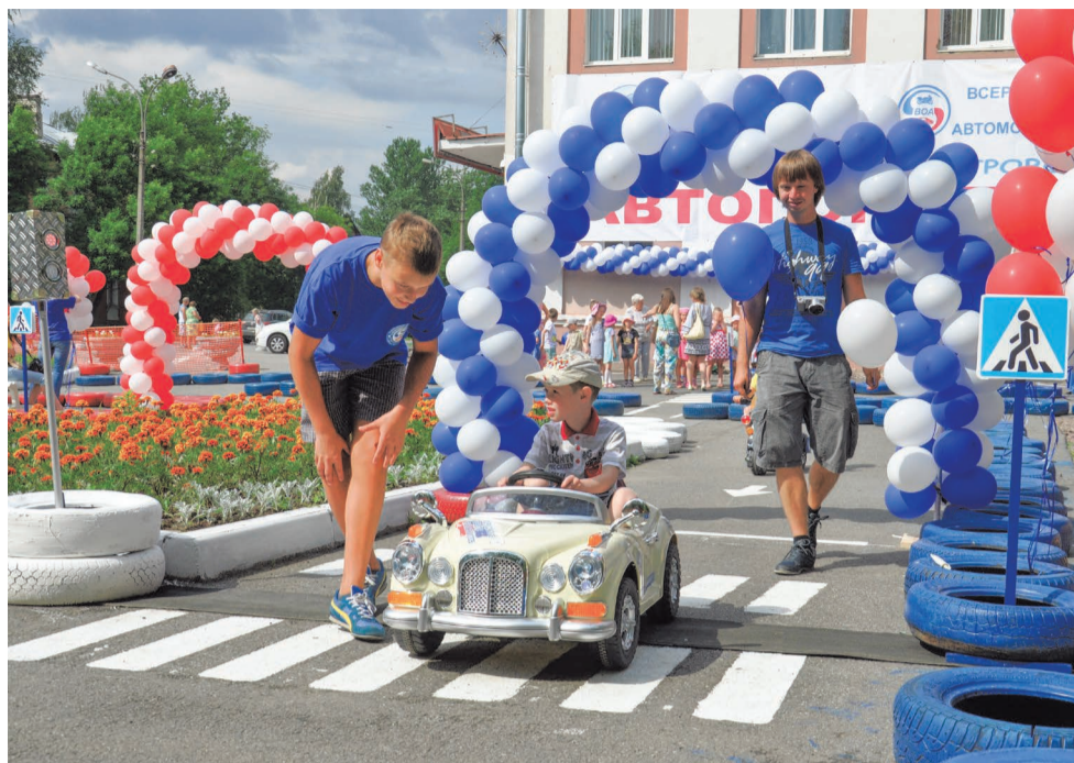
График обучающих игр для детей

Теперь, в хорошую погоду, каждый ребенок в возрасте от 3 до 9 лет, может не только прокатиться на точной копии ленд ровера, бмв, бентли или мотоцикле, но и посмотреть интересные мультфильмы о правилах дорожного движения, поучаствовать в обучающих играх. Получить первые положительные эмоции от вождения смогут также самые юные жители. Для тех, кто ещё совсем мал или не понимает, как водить машину предусмотрены пульты управления, при этом удовольствие от вождения получает как