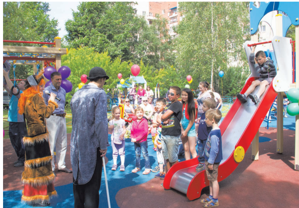
Открытие площадки во дворе дома Чекистов, 38

ведения на дороге, ведь в летний период дети отвыкают от интенсивного дорожного движения. За правильные ответы детям вручали подарки - модели автомобилей.