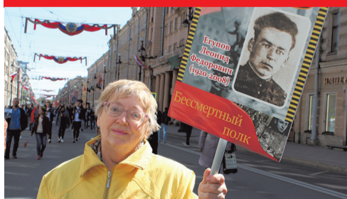
Портрет жителя Сосновой Поляны