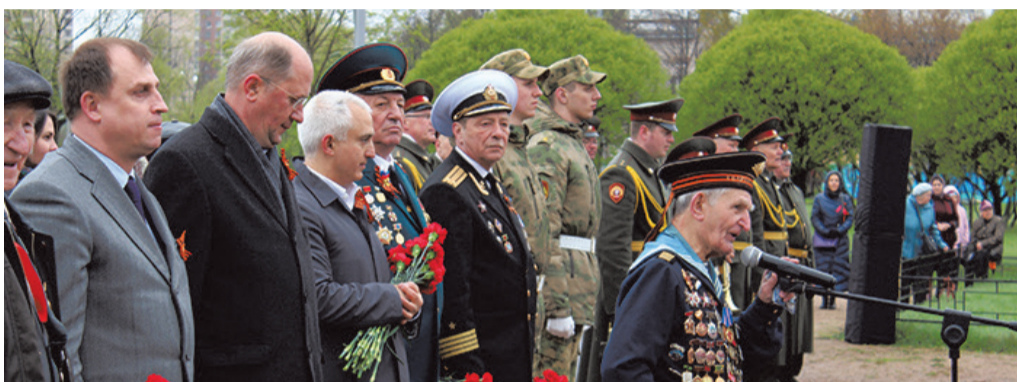
По следам праздничных мероприятий

ПЕЧАТНЫЙ ОРГАН МУНИЦИПАЛЬНОГО СОВЕТА МО СОСНОВАЯ ПОЛЯНА