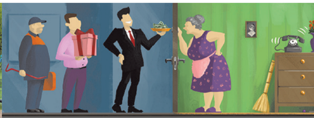
Как не стать жертвой мошенников