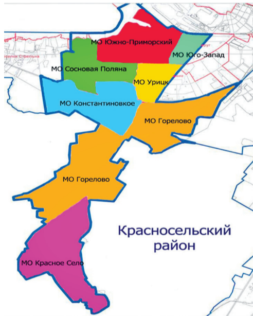
Современные границы МО Сосновая Поляна и соседей

Только одни эти названия поднимают огромный пласт истории, начиная с допетровских времен, когда эти земли, Водская пяттина, входили в сферу интересов Господина Великого Новгорода, затем принадлежали шведской короне, а хозяйствовали на земле финны-ингерманландцы, вожане и ижорцы. Именно Петр I изменил роль этих земель, отвоеванных им у шведов в ходе Северной войны. И заложил основу для их преобразования. С XVIII века мы можем проследить изменения на территории, называемой в те времена Стрелиной мызой. Тогда территориальное деление было иное: Стрелиной мызе принадлежали большие императорские владения. Хотя территория была заселена местным населением, свободной земли было много. Петр I раздавал ее своим приближенным, планируя устроить «второй Версаль». Местность прирастала загородными усадьбами, фрагменты которых мы видим до сих пор, несмотря на все пронесшиеся исторические катаклизмы.