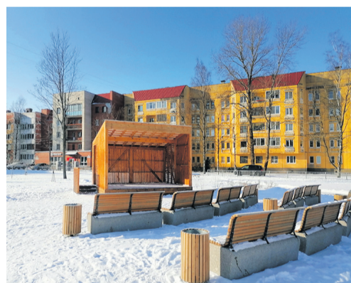
Современный поселок Ленино

В начале 2000-х постройки военного ведомства были перепрофилированы и частично перестроены под жилье. То, что для этих целей не годилось, снесли, а на месте снесенных зданий вырос жилой квартал.