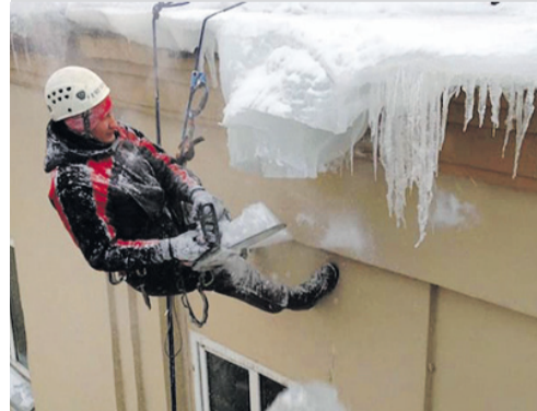
Ответственность за ненадлежащее содержание общедомового имущества