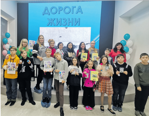
Дневные звезды – музейный форум