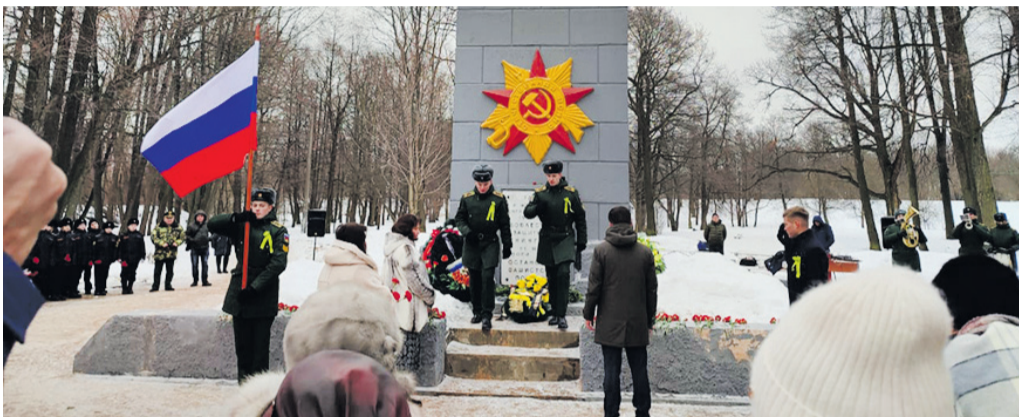
80 лет со дня полного освобождения Ленинграда от фашистской блокады

ПЕЧАТНЫЙ ОРГАН МУНИЦИПАЛЬНОГО СОВЕТА МО СОСНОВАЯ ПОЛЯНА