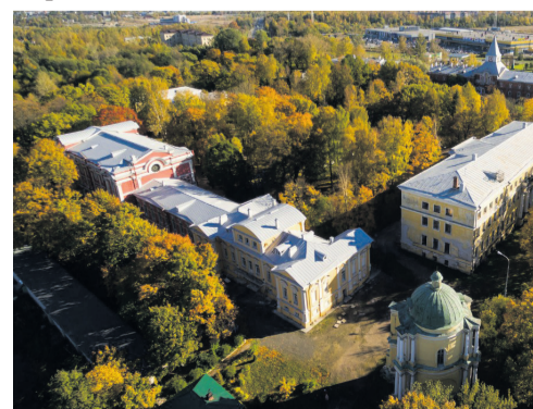
Троице-Сергиева Пустынь на Петергофской дороге