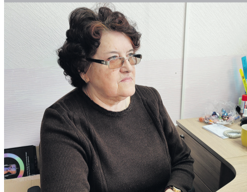
Я работаю в Сосновой Поляне

Обязательными участниками судебных процессов являются адвокаты. Они - гаранты объективного и всестороннего рассмотрения в судах уголовных, гражданских и арбитражных дел. Именно эта категория юристов способствует принятию законных и справедливых судебных решений. Об этом свидетельствуют истории, рассказанные адвокатом нашего муниципального образования.