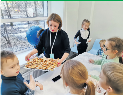
Весна. Каникулы. Книги!

Месяц март в детском отделе библиотеки «Книга плюс» наполнен незабываемыми событиями, акциями, встречами, игровыми программами! Продолжаются экскурсии по библиотечному пространству для воспитанников дошкольных и общеобразовательных учреждений; проходят литературные утренники, познавательные книжные игры и многое другое.