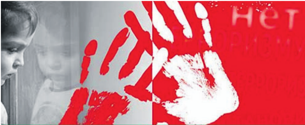
Терроризм - угроза обществу

ПЕЧАТНЫЙ ОРГАН МУНИЦИПАЛЬНОГО СОВЕТА МО СОСНОВАЯ ПОЛЯНА