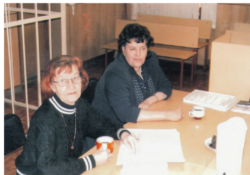
Через 30 минут заседание суда

лиц из числа детей-сирот и детей, оставшихся без попечения родителей, выселение из указанного жилого помещения;