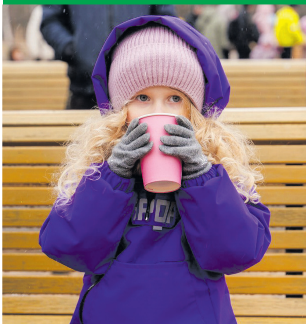
Масленица. Вот и зима прошла...