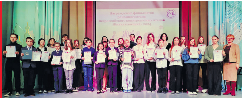
Учащиеся Сосновой Поляны – призеры конкурса чтецов «Живая классика – 2024»