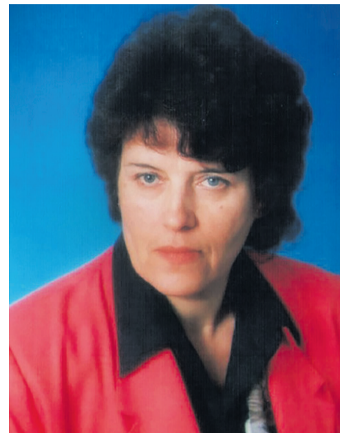
Двадцать лет назад...